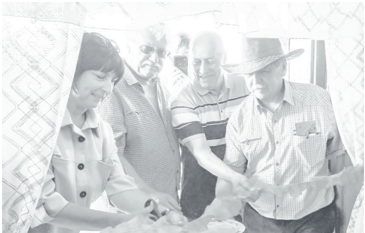
Музей в д. Губиной открыли торжественно.