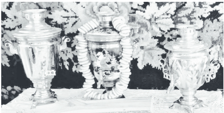
Эти экспонаты подарили музею выходцы из деревни.

Екатерина ОГНЕВА