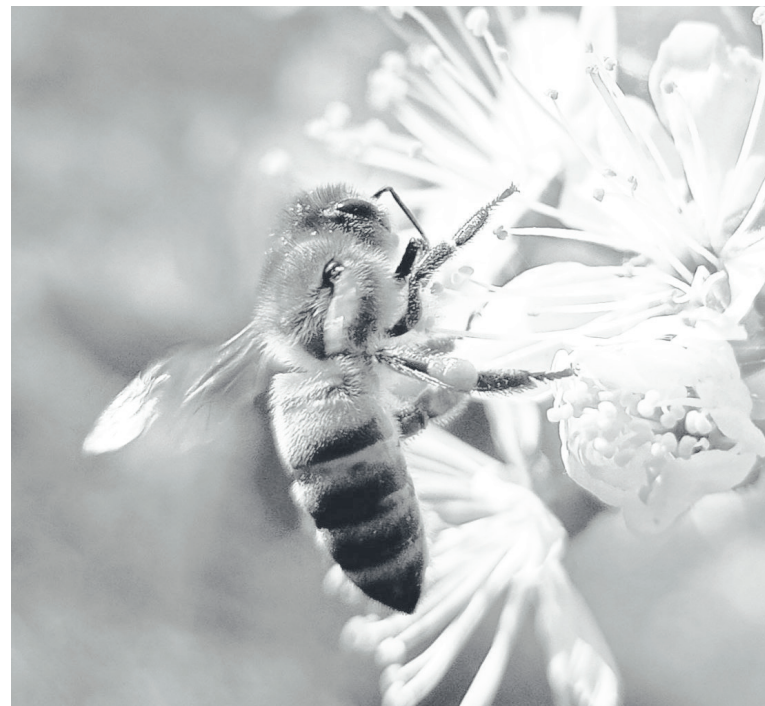
Одна пчела за день посещает до семи тысяч цветков.