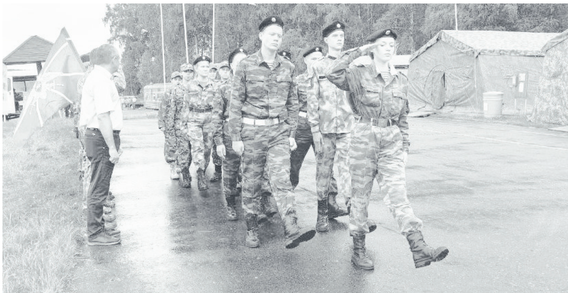
Даже ненастная погода не помешала курсантам пройти чётким строевым шагом.