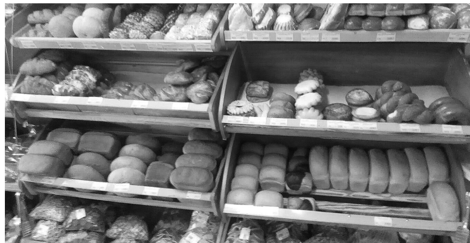
Ассортимент предприятия рассчитан на разных клиентов

Время не стоит на месте, меняются технологии в производстве кондитерских изделий. Стараемся