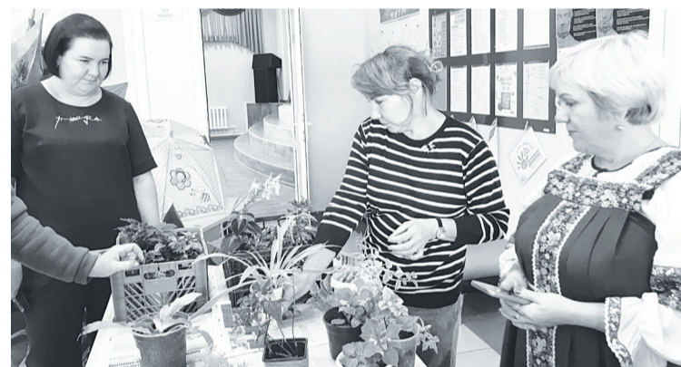
На прилавке был представлен широкий выбор комнатных растений.