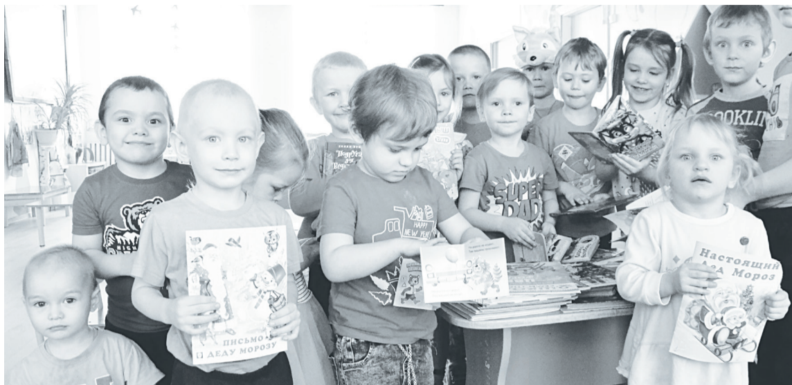
Воспитанники Крашенининского детского сада, 2022 год.

Часто такое происходит, когда в семье рождаются младшие братья или сёстры. И старшему торжественно объявляют, что теперь он должен «обслуживать» младшего, отвечать за его настроение, поведение, отдавать всё по перво-