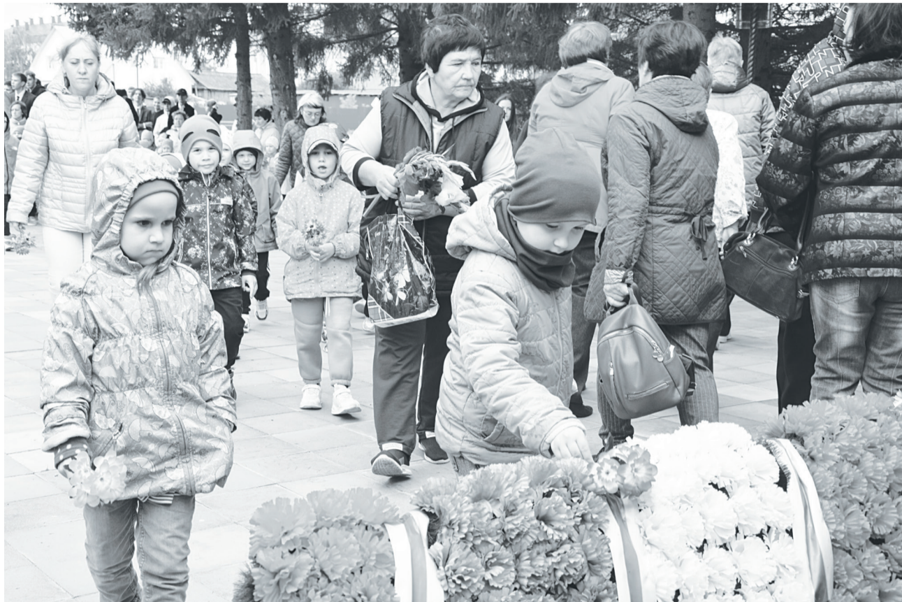
Третьего сентября, в День окончания Второй мировой войны и в День солидарности в борьбе с терроризмом, жители райцентра возложили цветы к памятнику воинам-землякам на ул. Крупской в с. Упорово.