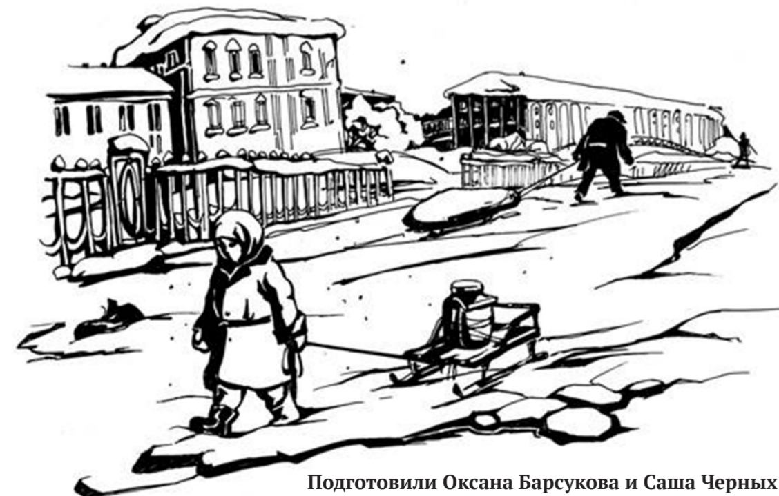
Подготовили Оксана Барсукова и Саша Черных