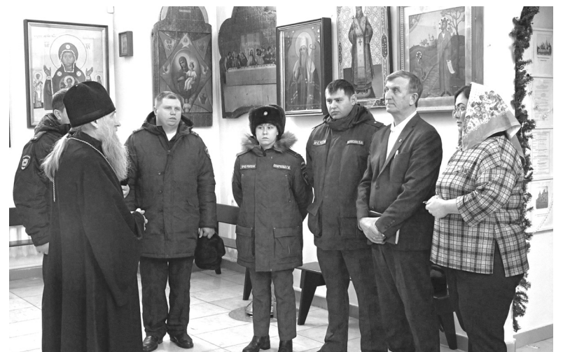
Накануне праздника в голышмановском Храме Вознесения Господня прошло совещание, где обсудили вопросы подготовки к Крещению Господню