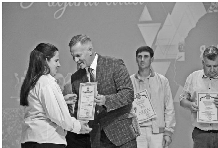
➤ Олег Серебряков вручает Благодарность коллективу ИМТ

Тюменская область является единственным регионом в России, простирающимся от морей Северного Ледовитого океана и до государственной границы на юге. Площадь области с автономными округами — 1464 173 квадратных километра. Наша область занимает третье место по площади среди субъектов РФ, уступая лишь Якутии и Красноярскому краю. Это крупнейший нефтегазоносный регион России и один из крупнейших в мире. Большая часть российской нефти добывается в Югре, газа — на Ямале. В этом году наша область отмечает свой 81 год рождения!