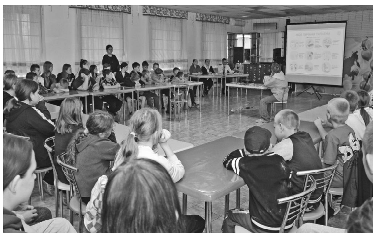
➤ Встреча со специалистами Роспотребнадзора