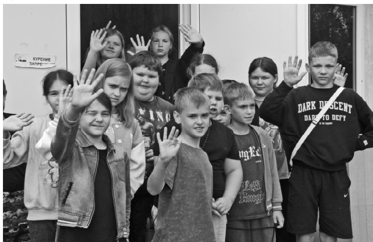
➤ Активные будни

Из-за большой воды первые смены в детском оздоровительном центре «Русичи», как говорят, ушли под воду. Коллектив долгое время добирался на работу на лодке, для детей такая переправа опасна.