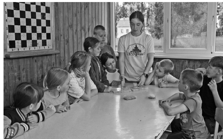
➤ Работа кружков