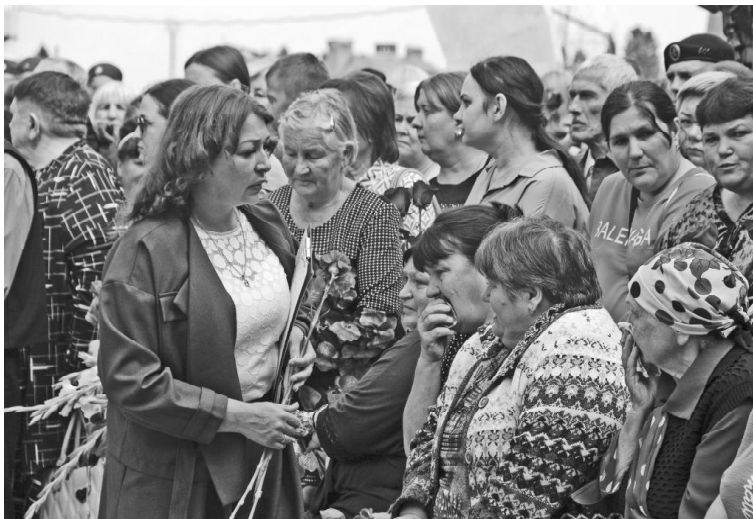
➤ Обращение к жёнам и матерям погибших бойцов