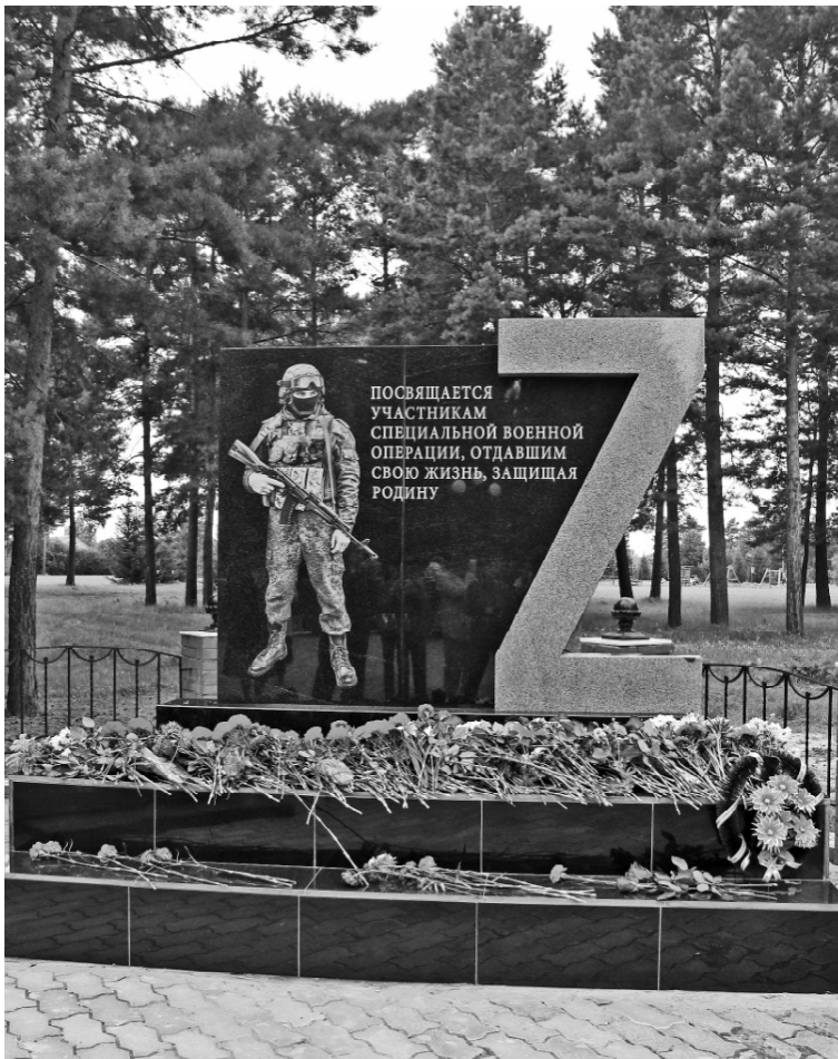
➤ Памятник ребятам, погибшим на СВО, с. Викулово

Волонтёры Победы, участники «Движения первых», юнармейцы, старшеклассники военнизированных классов вносят портреты погибших солдат. Сколько лиц молодых и зрелых