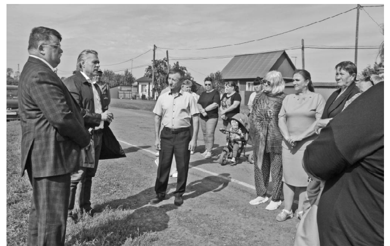
➤ Беседа с жителями с. Коточи