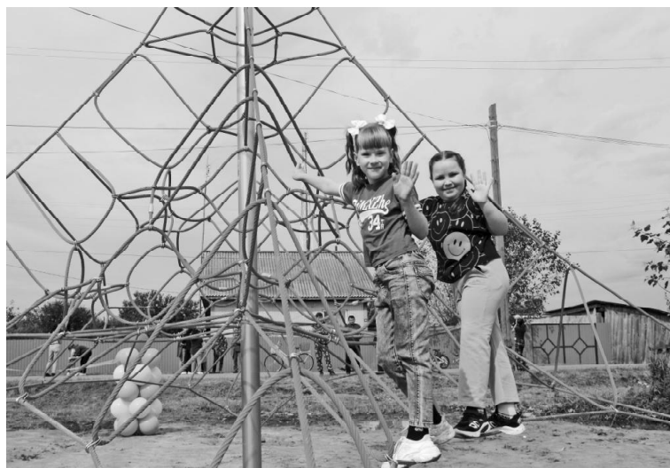
➤ На площадке в Балаганах