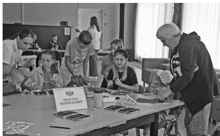
➤ Мастер-классы в День области