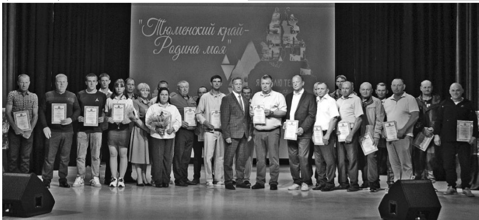
➤ Награждение тех, кто работал и помогал в период паводка на р. Ишим в 2025-м году