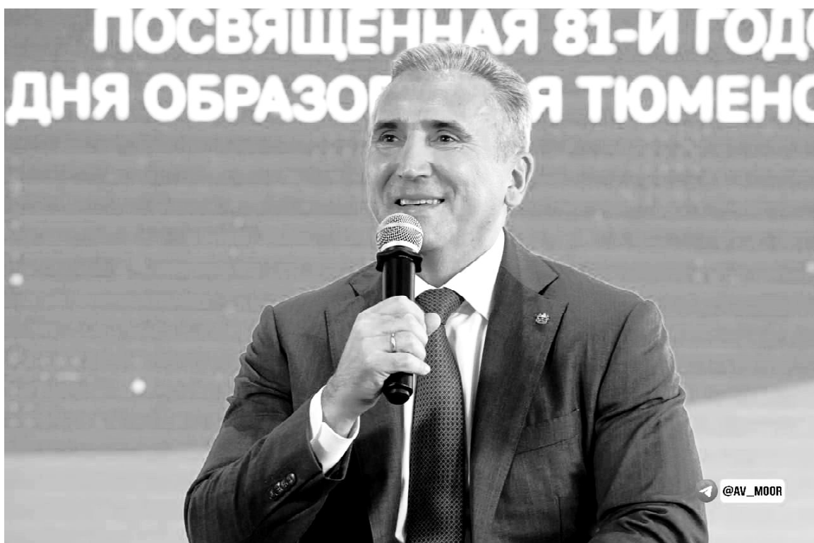
➤ Александр Моор

Отдельное внимание уделили Году героев. Запущен уникальный проект «Боевой кадровый резерв» – это программа, которая помогает трансформировать боевой опыт в управленческие компетенции.