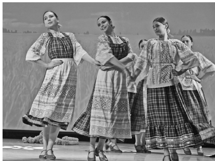
➤ Танец от «Фиесты»