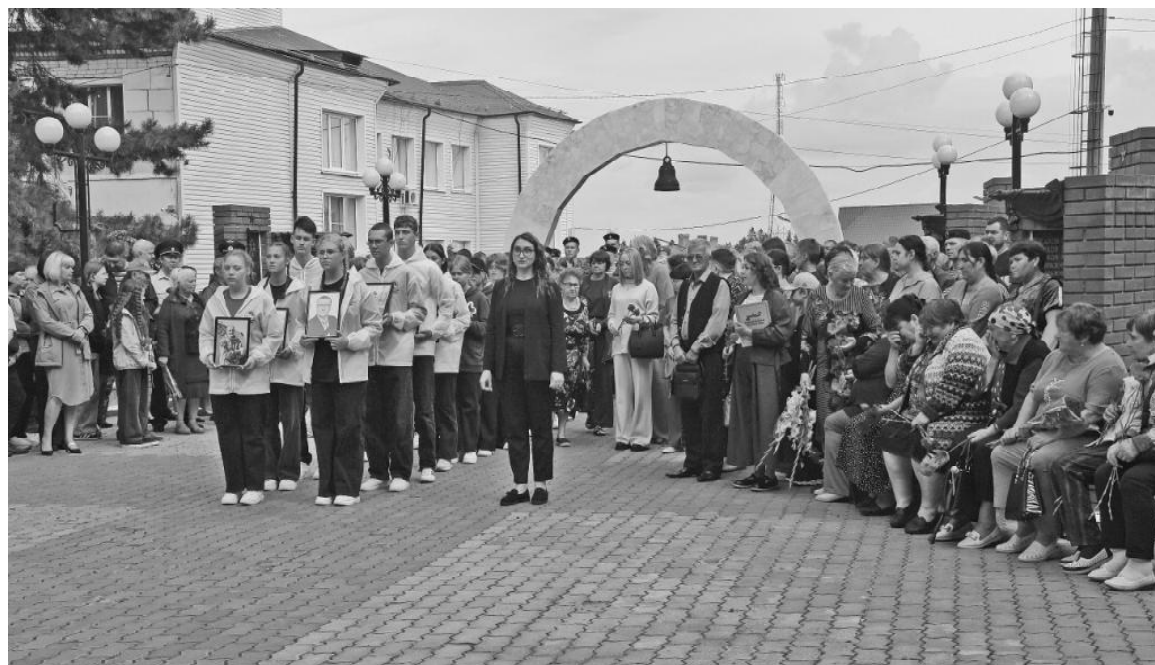
➤ На открытии памятника