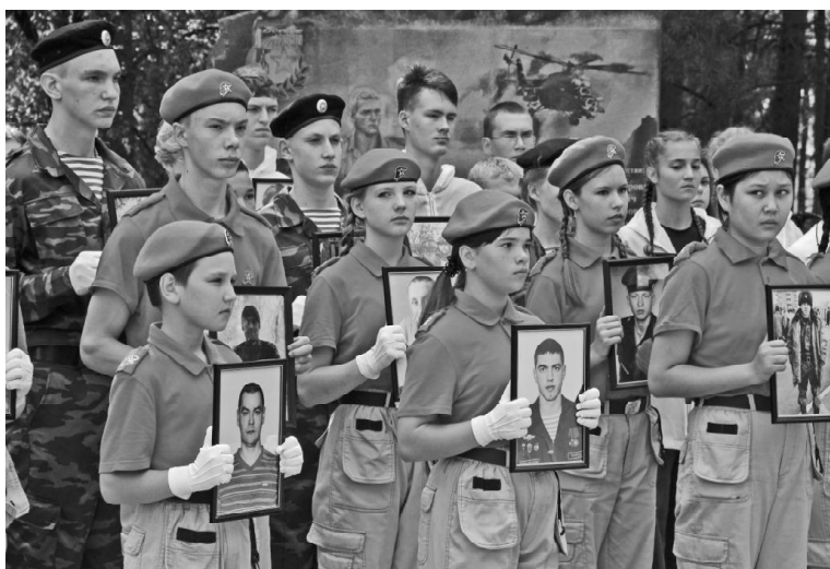
➤ Викуловская молодёжь с портретами погибших на СВО земляков

24 февраля 2022 года началась специальная военная операция на Украине. На пунктах мобилизации, которая началась осенью, родные, знакомые и земляки провожали ребят — это самый тяжёлый репортаж из моей работы. Горько было видеть слёзы, слушать напутствия, снимать отъезжающие автобусы, газели, которые по христианскому обычаю крестили вслед... Тогда мы, кажется, и не понимали, и не верили, что это происходит в наше время. Так хотелось, чтобы всё это скорее закончилось.