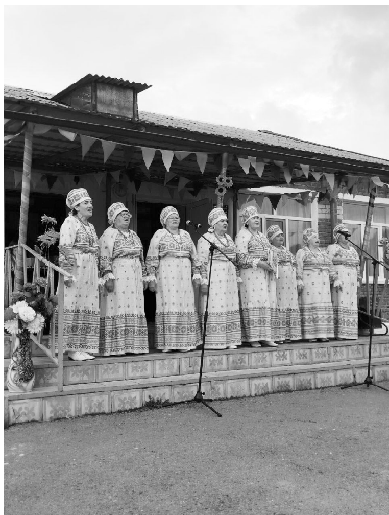
➤ Выступает «Россияночка»

17 августа уютная улица Школьная села Ермаки доказала, что она не просто адрес на карте, а настоящая большая семья. Здесь с размахом и невероятной душевностью отметили традиционный праздник улицы, который на этот раз превратился в яркий калейдоскоп радости, уважения и соседского тепла.