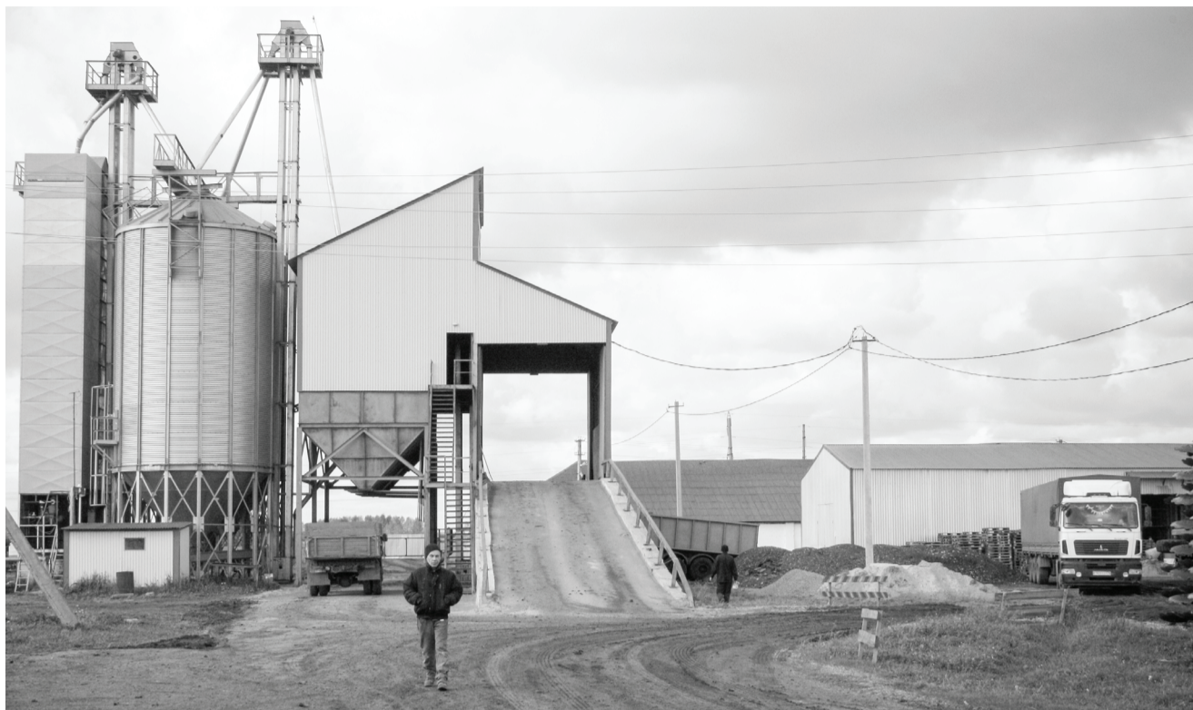
Сортировально-сушильный комплекс «Петкус» позволяет подработать весь урожай зерновых.

– Хорошо, что львиную долю зерна мы убрали при хорошей погоде, – продолжа-