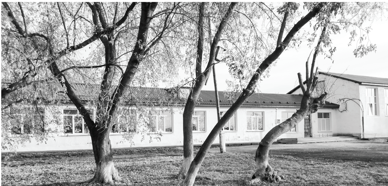
Неволинская основная школа – обыкновенное сельское учебное заведение, таких в России великое множество. В ней царит доброжелательность, создают которую учителя вместе с учениками и их родителями.

Как только завершился учебный год, строительные бригады приступили к работам. Особое внимание было уделено замене напольного покрытия и кровли.