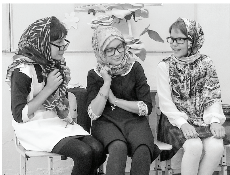
Ученики школы пригласили к себе на праздник бабушек и дедушек. Ребята с большим удовольствием показывали им яркие и красочные номера.

День пожилых людей – это день человеческой мудрости, зрелости, душевной щедрости – качеств, которыми наделены люди, имеющие за плечами немалый жизненный путь.