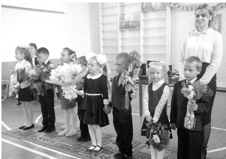
В этом году первый раз в первый класс Неволинской ООШ пришли девять ребят.