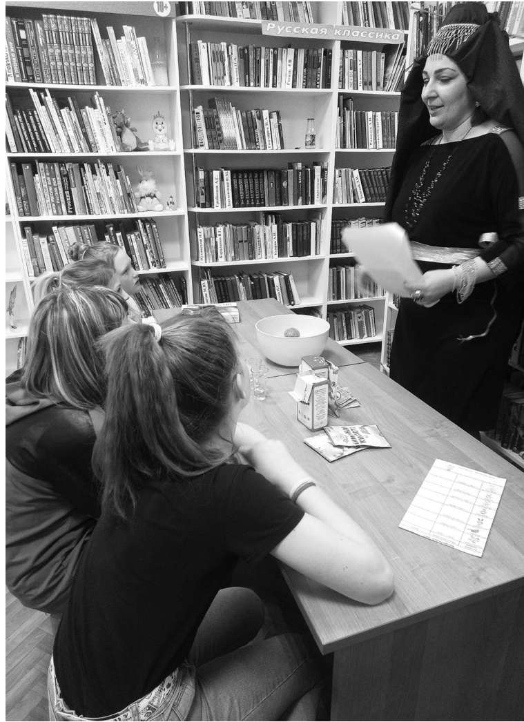
Школьники с интересом погрузились в мир космоса

Каждый библиотекарь вложил частичку своего творчества в организацию