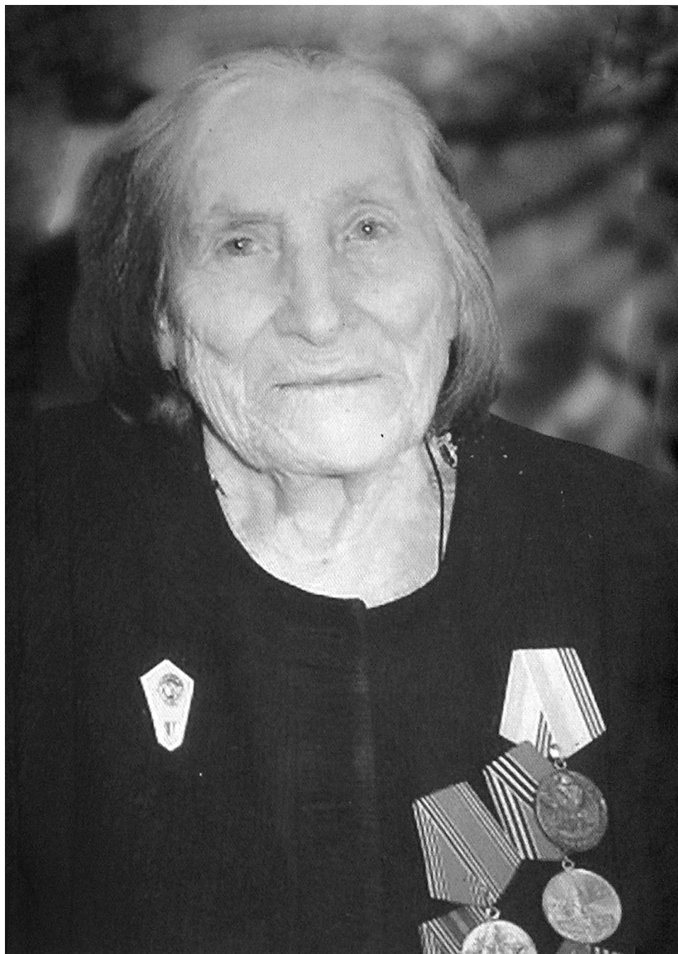
Непростая участь выпала на долю юбиляра, но она, как и прежде, полна оптимизма и жизнелюбия

– Тётя работала в Ишимском санатории, а дядя – машинистом на железной дороге, – вспоминает близких юбиляр. – Они были хорошими людьми. Татьяна Филимоновна отличалась строгостью, требовательностью к себе и другим, а дядя Вася был культурным, образованным человеком. Хорошо помню, как из поездок он привозил подарки. Помню, когда они вошли в дом по возвращении из поездки по Узбекистану, ароматы яблок и дыни наполняли весь дом! Никогда не забуду и привезённое для меня пальто. Какая это была радость! В то время готовую одежду не продавали, её либо шили сами, либо перешивали из старых вещей. Если объявляли, что будут продаваться ткани, ишимцы занимали очередь и стояли в ней даже по ночам, записывая номер своей очереди на руке. Но на всех товаров всё