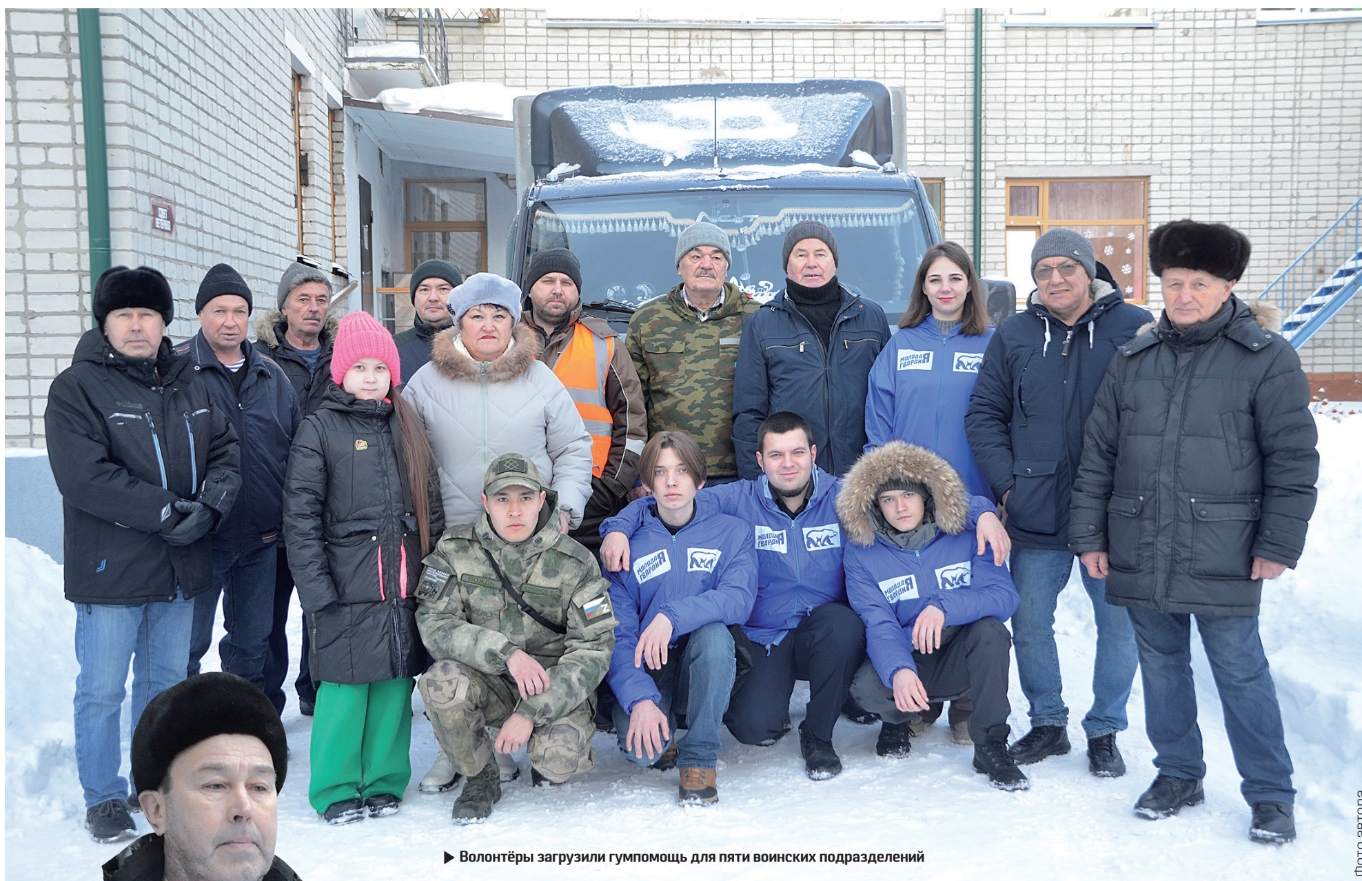
► Волонтеры загрузили гумпомощь для пяти воинских подразделений