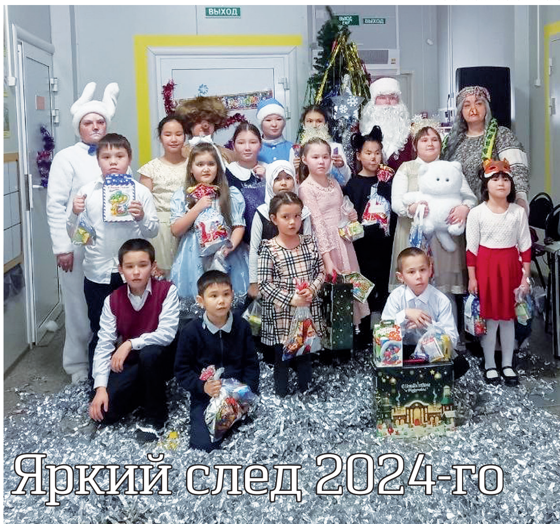
► Приключения ждали епанчинскую детвору. Но добро восторжествовало

Завершится региональный этап Всероссийской предметной олимпиады подведением итогов и торжественным награждением отличившихся 28 февраля. Обещаем, что будем следить за событиями и расскажем о победах и успехах наших участников.