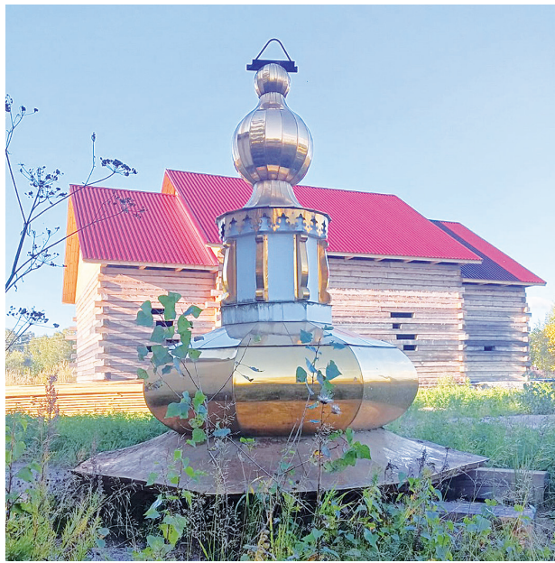
► Маковка готова к установке