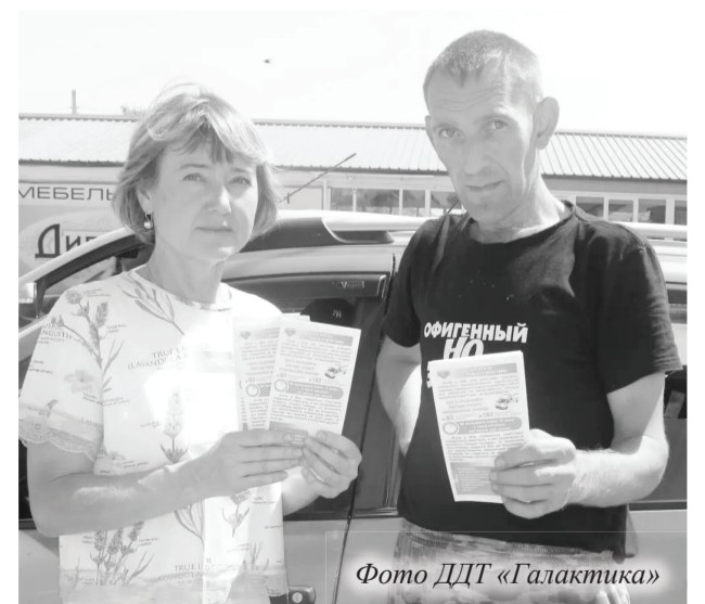
Фото ДДТ «Галактика»

Сердечно-сосудистые болезни остаются одной из главных причин смертности в мире. Полностью исключить все факторы риска невозможно, но каждый может снизить их влияние на своё здоровье. Главный инструмент – здоровый образ жизни. Правильное питание, регулярная физическая активность, своевременные профилактические осмотры и отказ от вредных привычек помогают сохранить сердце и сосуды здоровыми, отмечают организаторы акции.