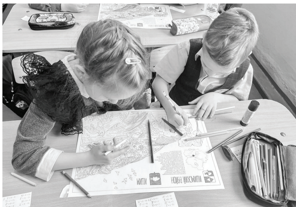
Видеоуроки дополняются уникальными раскрасками и открытками, которые используются и как дидактическое пособие, и как элемент арт-терапии.