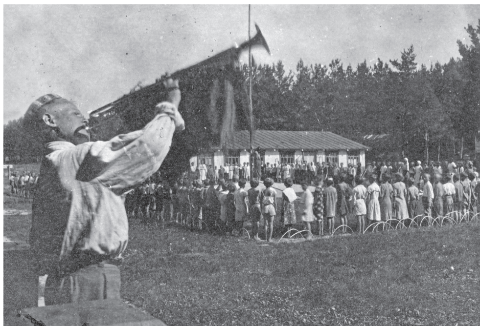
Утренняя линейка в пионерском лагере им. В.И. Ленина в Синицынском бору. Лето 1944 года.

Выражаем благодарность отделу по обеспечению хранения, комплектования, учета и использования архивных документов МКУ «Управление имуществом и казенными ресурсами г. Ишима».