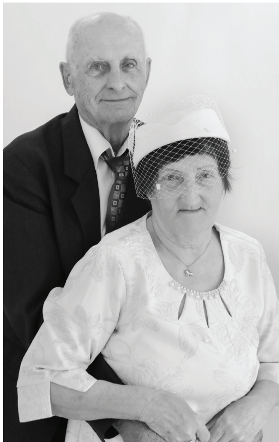
Еще одна добрая традиция комитета ЗАГС администрации города Ишима – вносить имена юбиляров в специальный памятный альбом.

– В 1968 году я приехала по распределению работать в Равнецкую школу учителем музыки. С будущим мужем познакомились на праздновании Дня рождения комсомола, он долго ухаживал. Весной следующего года его призвали в армию, и перед этим мы зарегистрировали в сельсовете брак, чтобы я смогла отправиться за ним к месту службы, – рассказывает