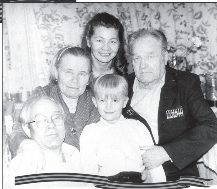
Золотая свадьба, 1991 г. С родными

но, и угодил на мину. Раздался взрыв. Не погиб, раз уж везучий! Контузило, да осколки попали в лицо и шею. Рота уж без него взяла высоту. А он – в госпиталь.