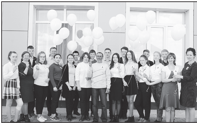
Белые шары в память о Чернобыле

Рассказать о деятельности АУ «Центр культуры и досуга Юргинского муниципального района» по укреплению единства и духовной общности многонационального народа России, других народов мира в рамках одного материала невозможно. Но и пропустить их заочные путешествия по странам и континентам тоже нельзя. Хотя бы их бесценное начинание «Библиотечные подмостки», которое собирает не только постоянных читателей и зрителей, – всех желающих от мала до велика. Знакомит с традициями и интересными национальными обычаями разных народов, их культурой. Проводится эта работа в рамках региональной целевой программы по реализации государственной национальной политики.