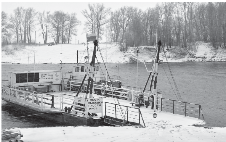
Месяца через полтора переправа в этом месте поменяет свой «статус» с паромной на ледовую

Корнеевы вспоминают, что случались в этом году и досадные недоразумения, связанные с желанием автомобилистов попасть на противоположный берег как можно быстрее. «Когда пошли грибы и ягоды, поток машин резко