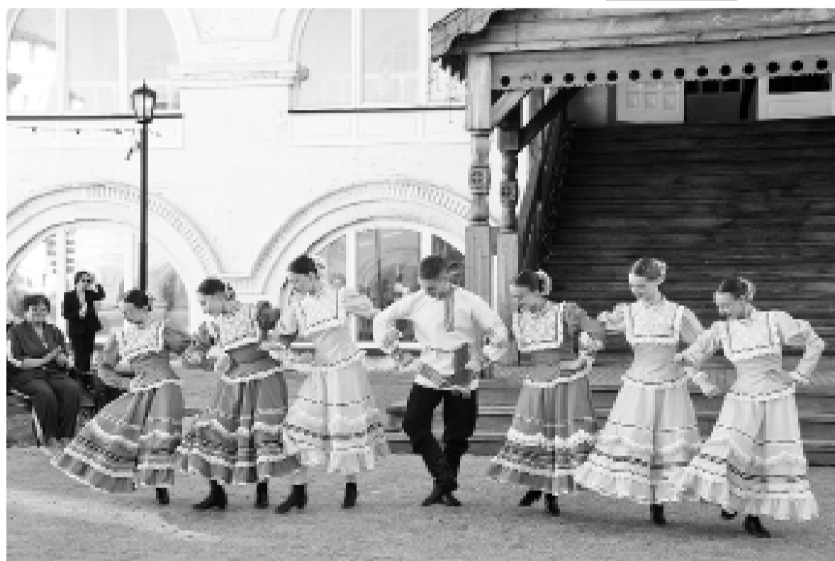
Настроение создаёт ансамбль «Дуслык»

Тобольск уже который год подряд участвует во Всероссийской акции «Ночь музеев». И, конечно, одним из центров её проведения становится Тобольский историко-архитектурный музей-заповедник.