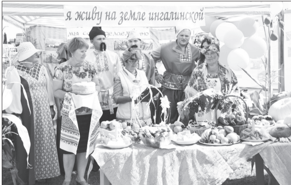
Вот такие богатые столы приготовили ингалинцы на День области.

День села – это подведение итогов работы и жизнедеятельности поселения, и каждый год работники культуры радуют односельчан новыми, интересными задумками. «У нас нынче Субботея» – так назывался конкурс среди улиц и организаций. Более 40 человек