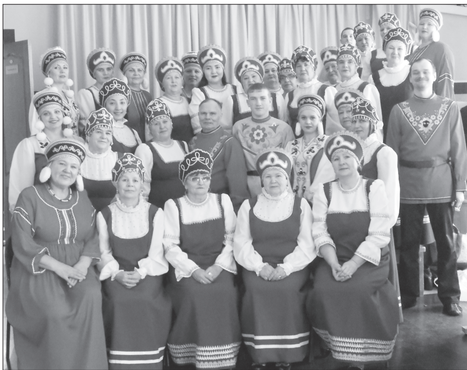
Хор «Вдохновение» стал лауреатом III степени в «Битве хоров – 2016».

из одноимённой деревни. Совместно с Липихинским СДК гостям представили быт, традиции, показали старинный свадебный обряд. А затем пригласили горожан на праздник кваса.