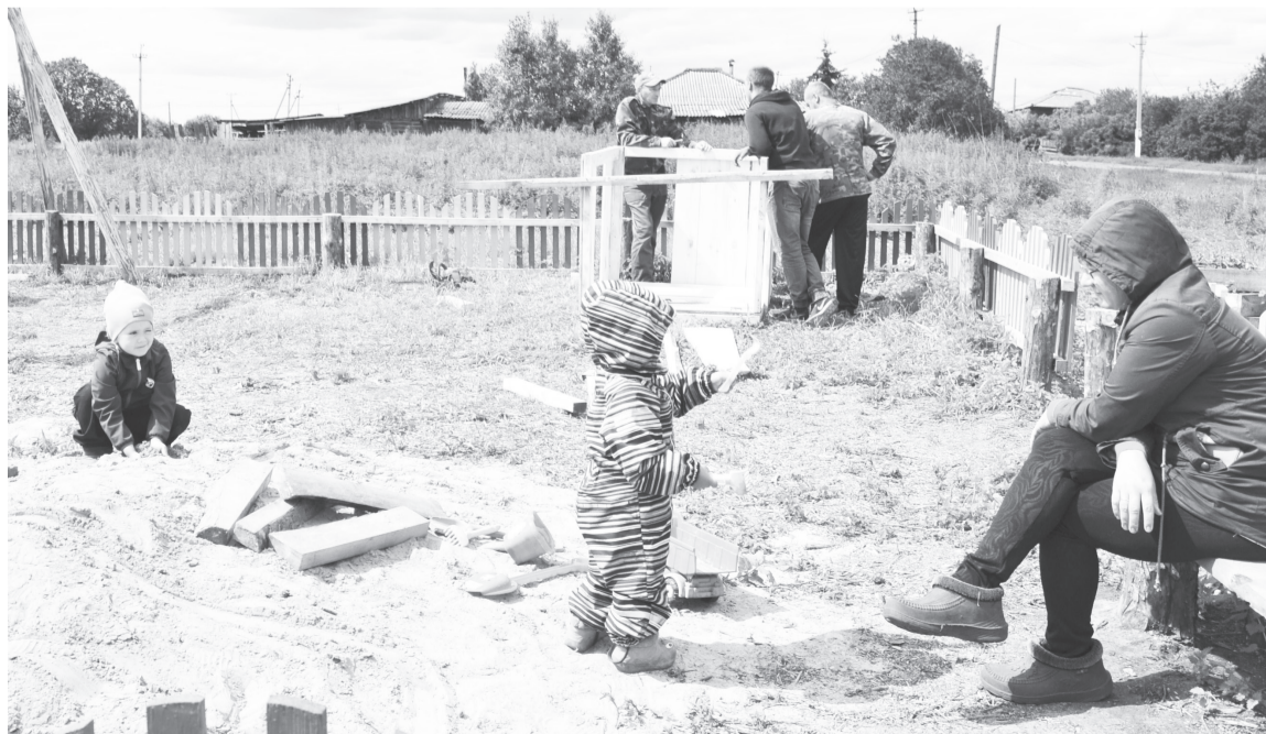
Липихинская детвора осваивает новое место для игр.

Поговорили и о ситуации в агропромышленном комплексе. Как известно, лето без своевременных осадков сказалось на урожайности зерновых культур и с кормами для скота зимой будет нелегко. Животноводческие предприятия изыскивают резервные возможности для пополнения запасов сена. На уровне правительства области рассматривается вопрос по поддержке аграриев, которые пострадали от засухи.