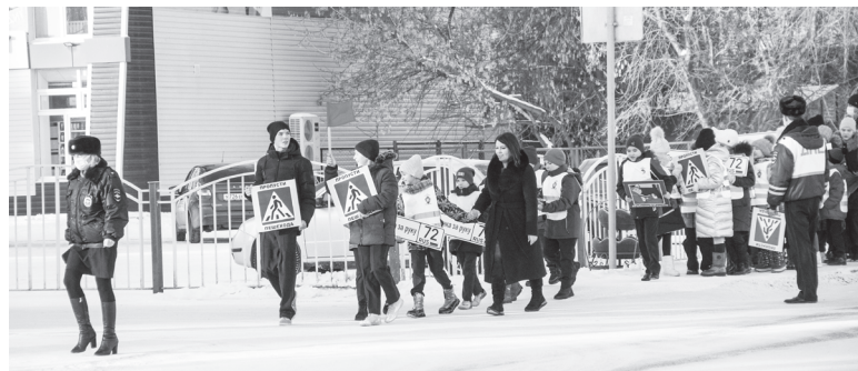
Любые знания лучше усваиваются на практике