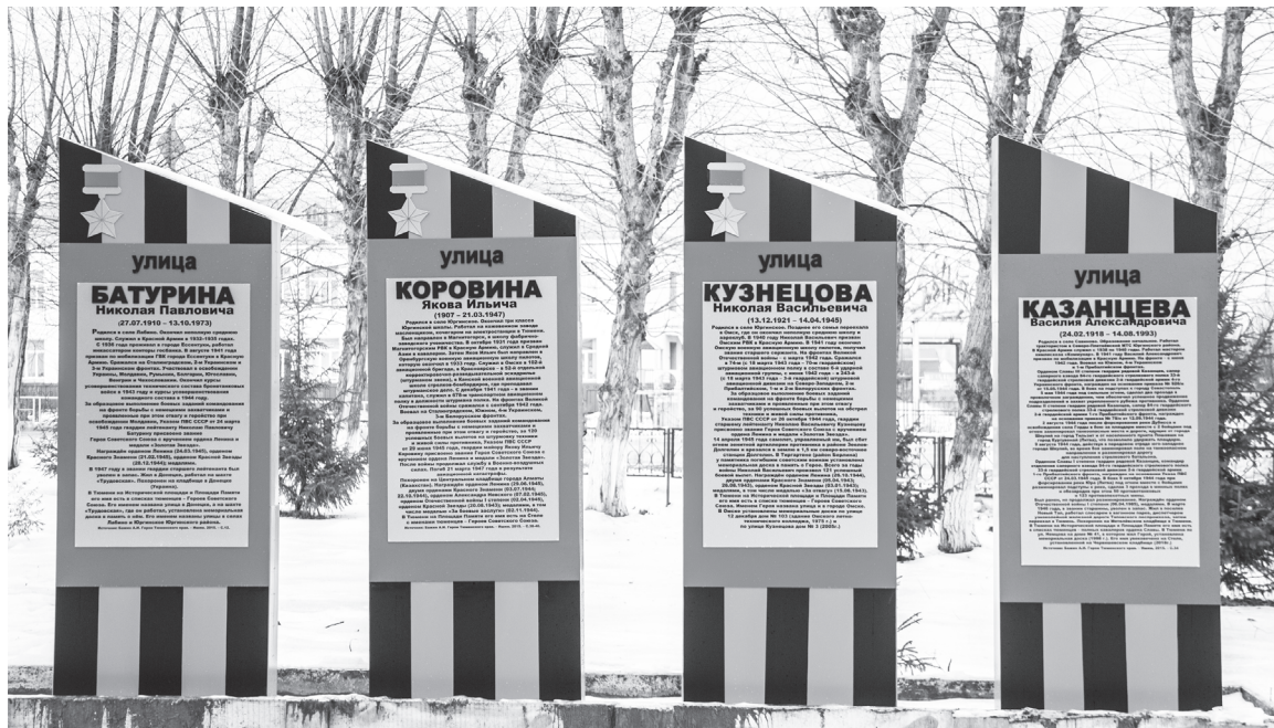
Мемориальные плиты установлены в центре села Юргинское – в сквере Победы