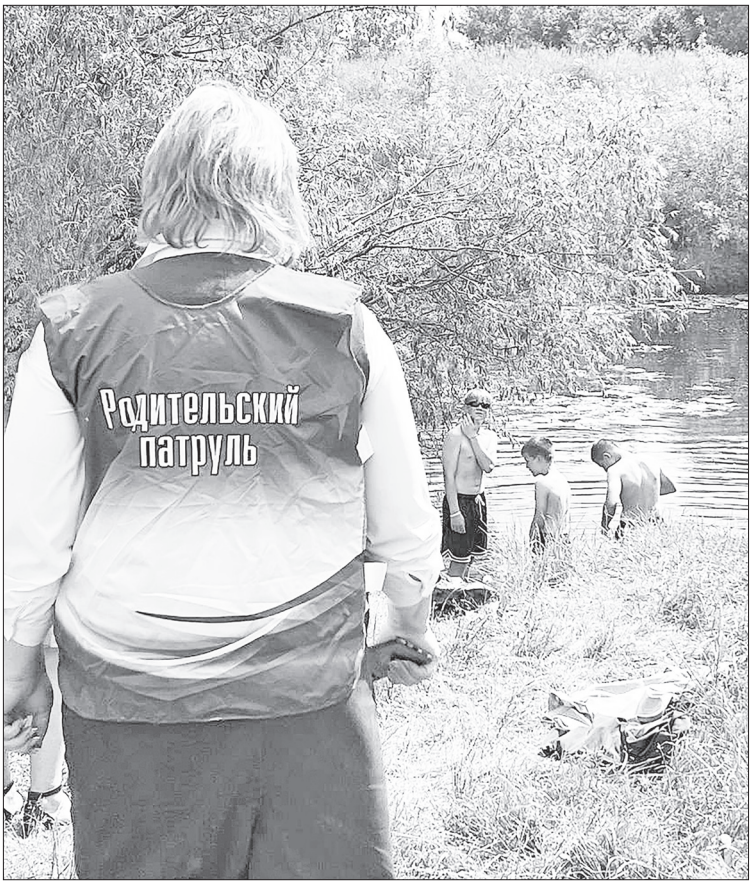
Родительский патруль развернул свою деятельность во всех уголках Нижнетавдинского района.

Также хочется уделить особое внимание отдыхающим. Начиная с пятницы и заканчивая утром понедельника, многие водные артерии Нижнетавдинского района заняты любителями активного отдыха, в частности – рыбалки. С моторными или резиновыми лодками или просто с удочка-