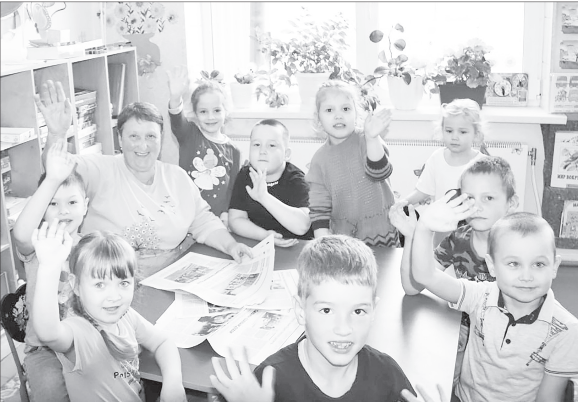
📸 Сегодняшние подопечные нашей героини, которые души не чают в своём воспитателе.