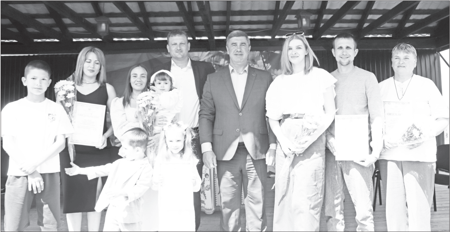
На празднике Дня семьи, любви и верности чествовали семьи, принявшие участие в региональном этапе Всероссийского конкурса «Семья года».

По решению правительства России она была учреждена в 2008 году и предназначена для вручения лучшим семьям России. Награждаются супруги, зарегистрировавшие заключение брака не менее 25 лет назад, получившие известность среди сограждан крепостью семейных устоев, основанных на взаимной любви и верности, а также добившиеся благополучия, обеспеченного совместным трудом, воспитавшие детей