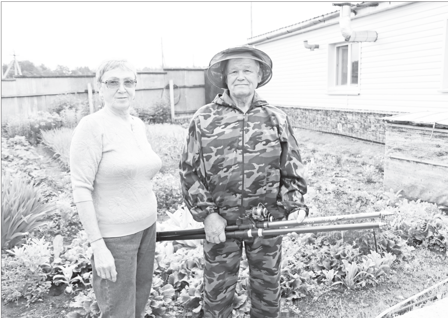
📷 Золотые супруги всё делают вместе – так и легче, и веселее. И жизнь радует.