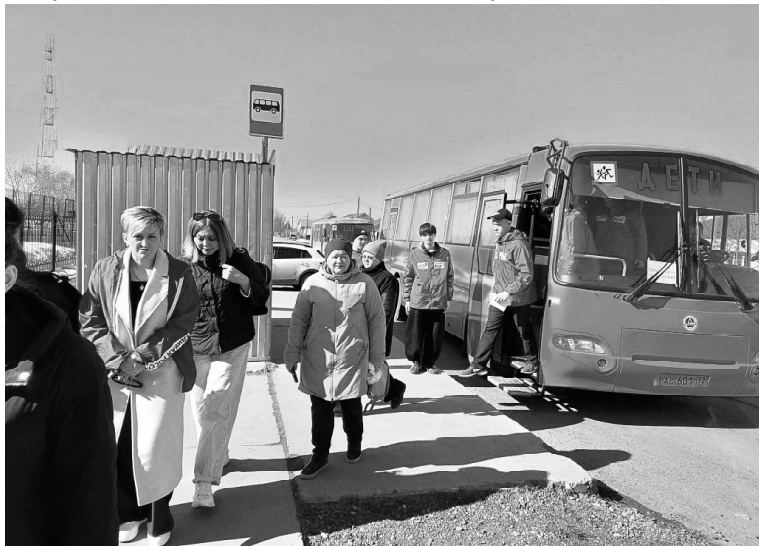
› Эвакуация в ПВР

ле этого «эвакуированных» повезли в пункт временного размещения, который расположен на базе Викуловской школы № 2. В фойе их регистрировали, размещали по комнатам, оказывали первую медицинскую помощь в случае необходимости, выявляли хронические заболевания и определяли состояние здоровья, выдавали талоны на питание. По опыту 2024 года, питание будет осуществляться четыре раза в день. В пункте временного размещения созданы все необходимые условия для проживания.