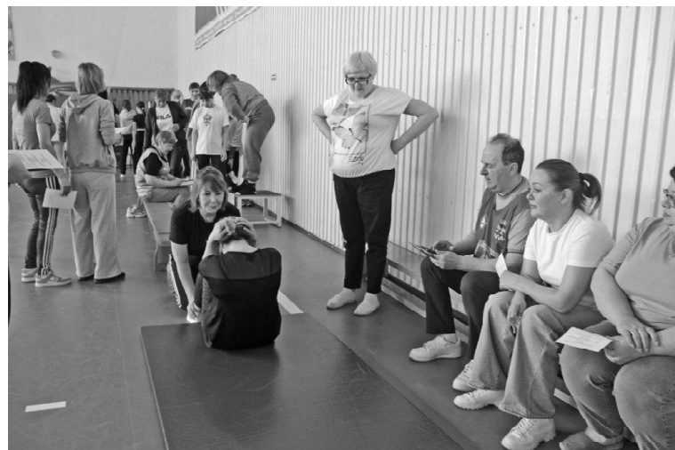
› Поднимание туловища