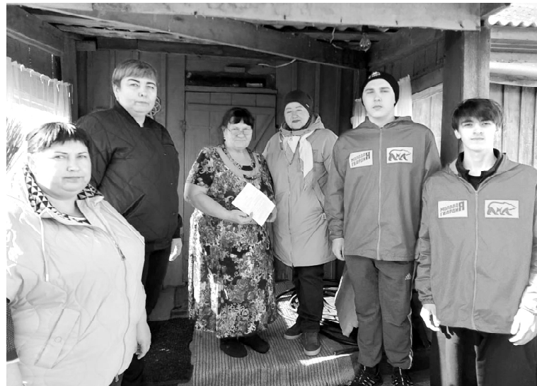
› Вручение памяток в с. Чебаклей