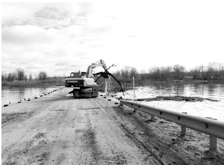
› ДРСУ-5 очищает наносы у моста в с. Балаганы

2 апреля в администрации округа состоялось заседание комиссии по предупреждению и ликвидации чрезвычайных ситуаций и обеспечению пожарной безопасности Викуловского муниципального округа. На нём присутствовали представители практически всех сфер деятельности. Главная тема – возможный паводок.