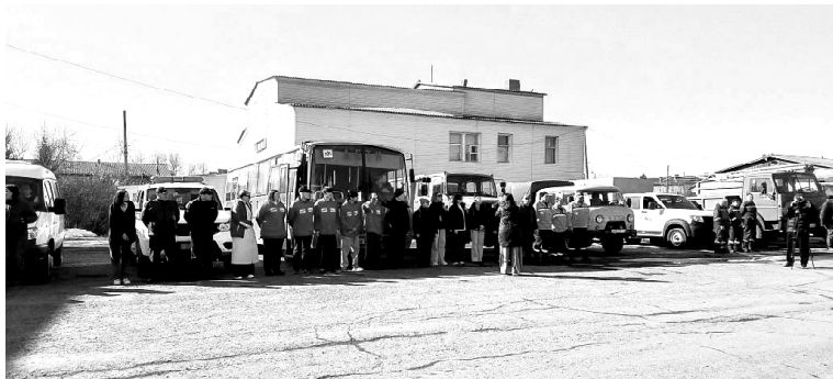
› Построение на территории ЖКХ

На прошлой неделе на территории Викуловского муниципального округа прошли командно-штабные учения. Они подразумевали отработку практических мероприятий, сил и средств, которые задействованы на территории округа при возникновении чрезвычайных ситуаций. В этот раз была отработка по паводку, где была угроза подтопления улицы в селе Чебаклей.