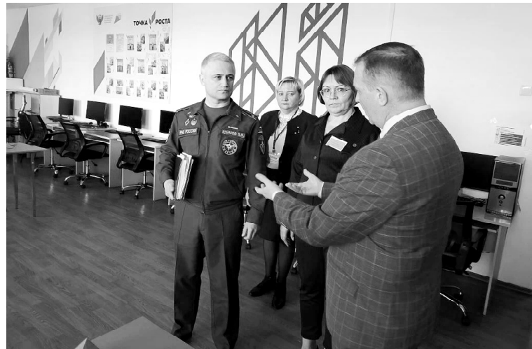
› Осмотр ПВР в Викуловской школе № 2

ния. Здесь расположены комнаты для проживания, зал ожидания, комната матери и ребёнка, изолятор, работает психолог. Выделен кабинет для работы специалистов управления социальной защиты населения и МФЦ.