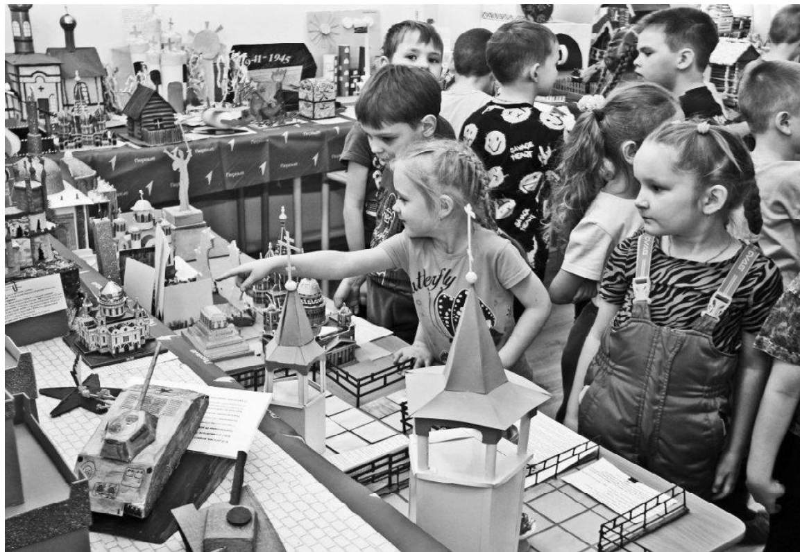
› На выставке детских поделок