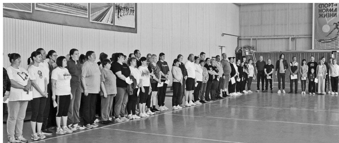
› На построении