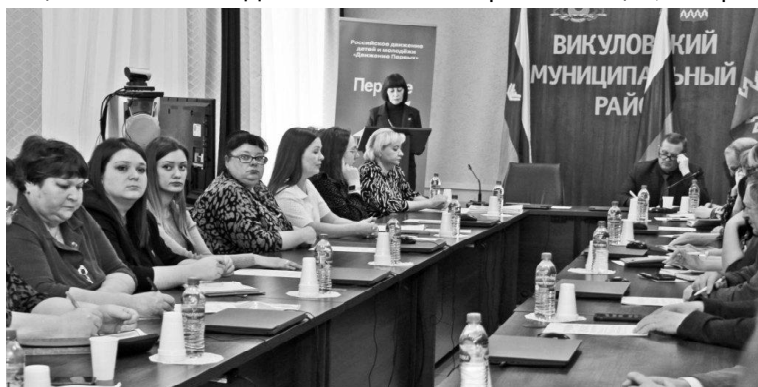
➤ Заседание совета Движения Первых