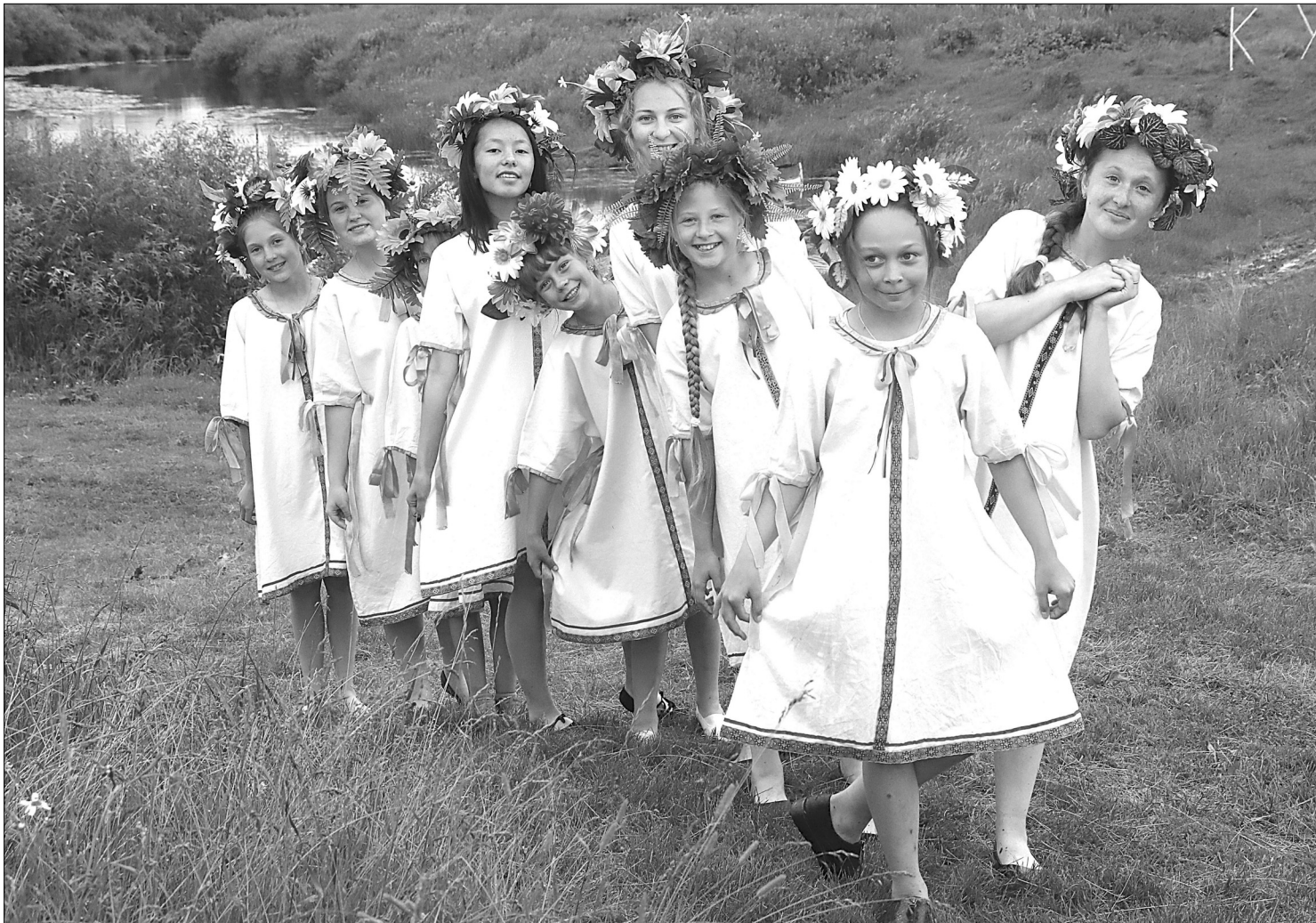
В старину девушки ходили в венке весь день, а ночью пускали по реке и примечали: пристанет к другому берегу – быть свадьбе!

ЕСТЬ НОВОСТЬ? ПИШИТЕ, ЗВОНИТЕ: ☎ 8-(34546)-2-50-34; 2-56-69 @GOL_VESTNIK@MAIL.RU