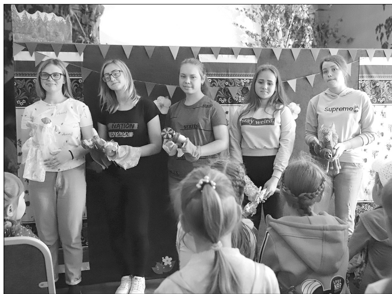
В завершение спектакля для маленьких зрителей открылась тайна: кукловоды показались из-за кулис