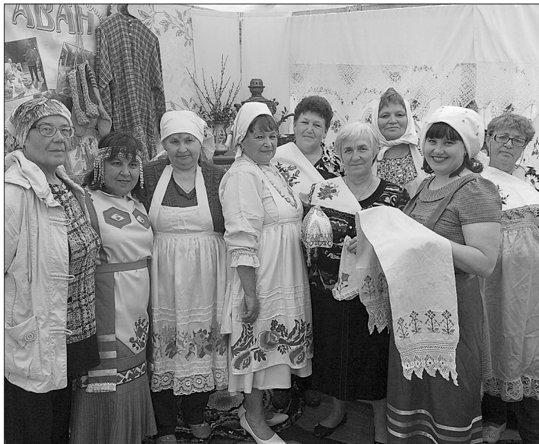
К лицу женщинам чувашские наряды

Активисты Голышмановского отделения общества инвалидов побывали в Медведево на чувашской агроусадьбе «Лучик Аван». Поездка состоялась в рамках проекта «Жить здорово!» – победителя конкурса гражданских инициатив. Два часа, проведенные на природе, подтвердили, что жить здорово, если люди активны, оптимистичны и добры.