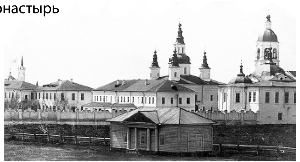
Знаменский монастырь

Глава города Петр Вагин объясняет, что идея создания памятников утраченным храмам Тобольска родилась в процессе работы над туристическим маршрутом по нижнему посаду. Памятник Знаменскому