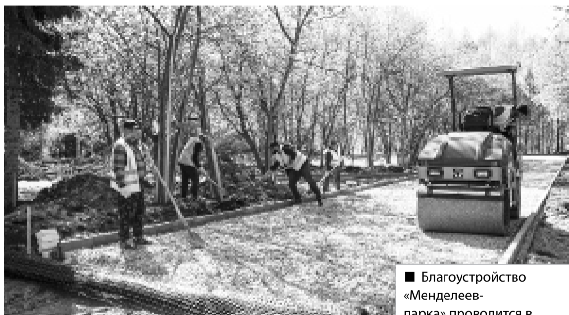
Трёхтонный каток трамбует щебень на новой дорожке

парк, как паутинка. Судя по всему, работы не останавливаются даже в выходные.