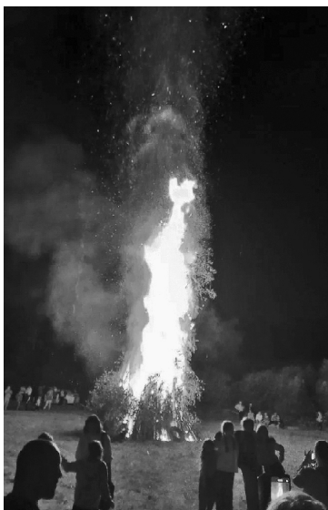
» Костёр Дружбы