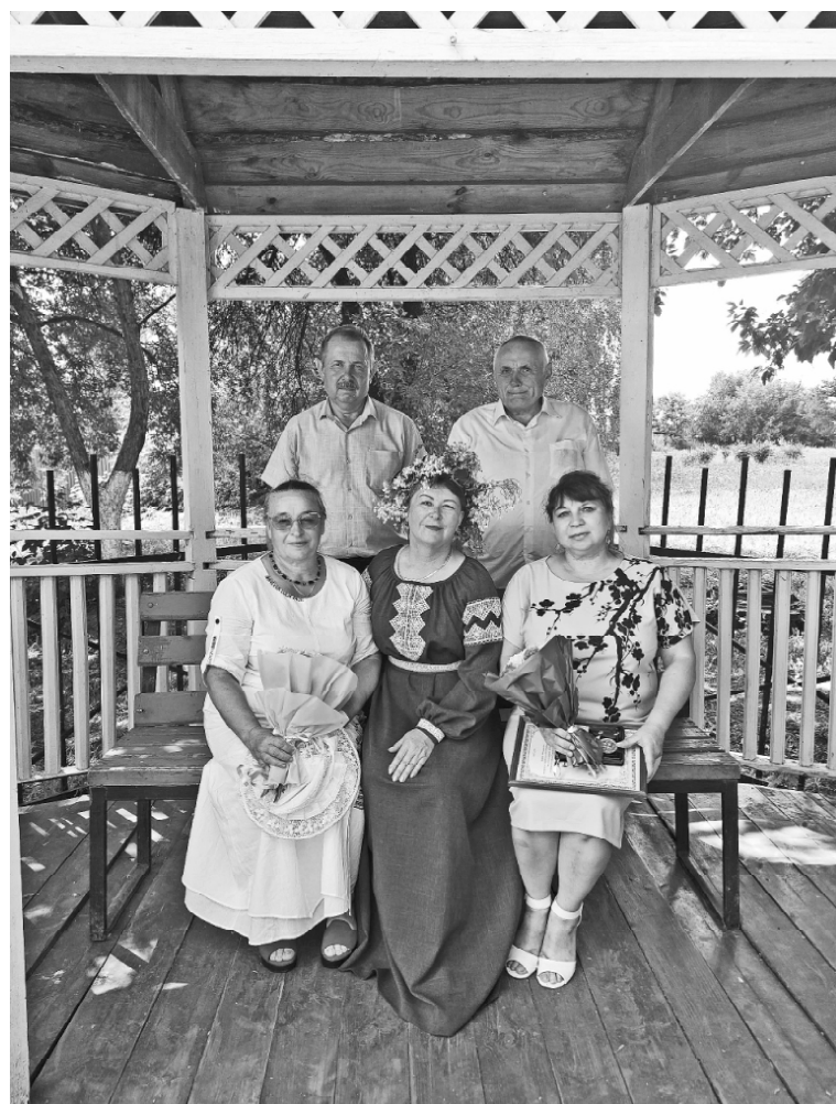
» Семейная встреча в музее