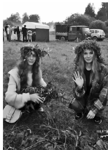
» Плетение венков

Подготовленные травы и цветы притянули к себе девушек: они плели веночки, надевали их на голову, а ближе к полуночи потихоньку спустили на воду – гадали на суженого. Гости праздника завязывали ленточки на берёзку, загадывали желания. Кто-то отправился на поиски цветущего папоротника, ведь, по поверью, только в эту волшебную ночь можно его отыскать. Прыгали через костерки. Для детей были организованы игры.