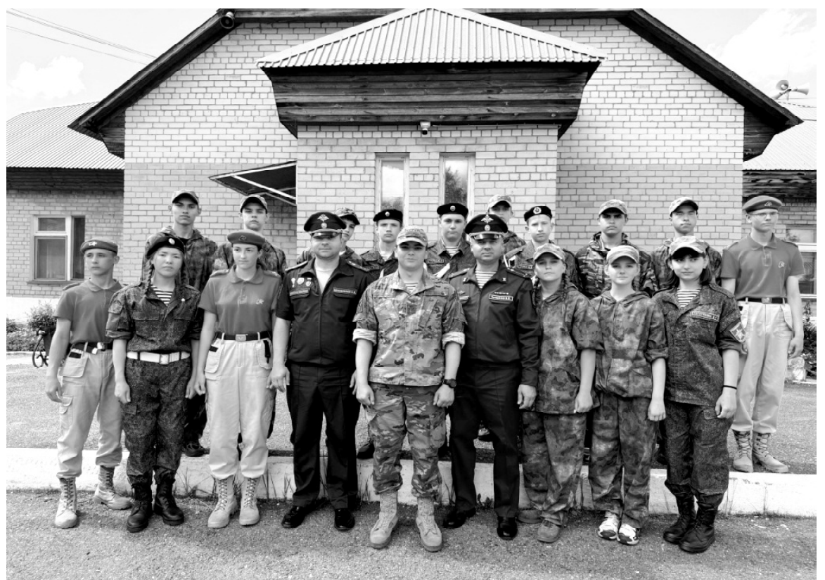
➤ На смене «Ратники» в Тюмени

По сложившейся традиции образовательных учреждений, наиболее активных ребят всегда как-то поощряют. Юнар-