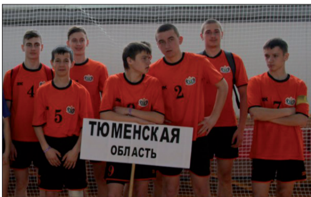
Юношеская сборная Тюменской области.

С 21 по 27 марта в г. Саракташе Оренбургской области проходило первенство России по мини-лапте среди юниоров и юниорок 1999-2001 г.р. В соревнованиях приняли участие 15 мужских и 11 женских команд. В обеих группах сборным Тюменской области удалось завоевать третьи места. В этом немалая заслуга и уватских спортсменов.