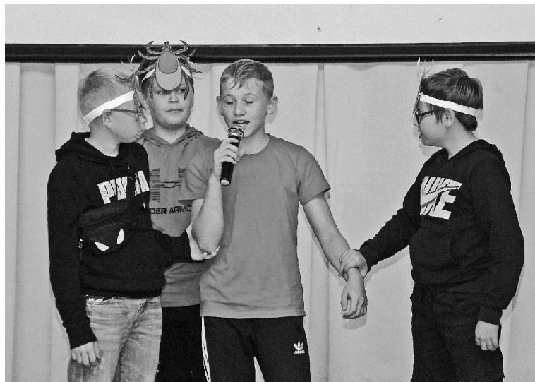
➤ Заключительное мероприятие профильной смены «Авангард – 2023» ВСОШ №2