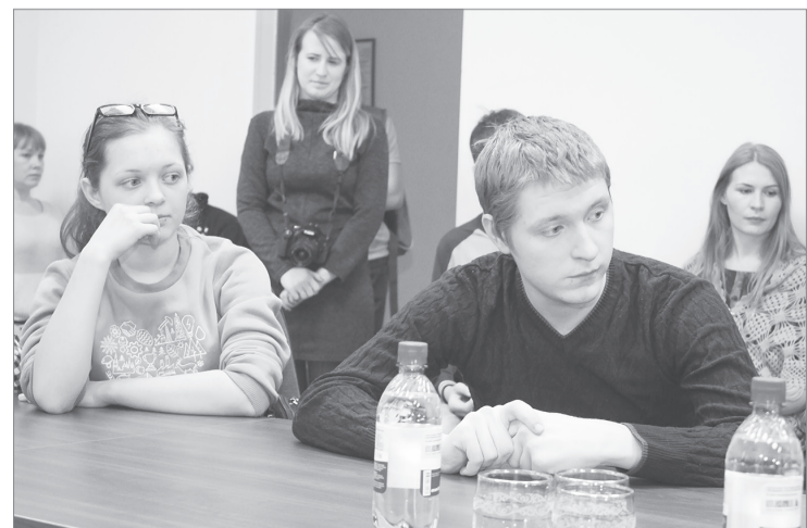
А какие бывают алмазы?