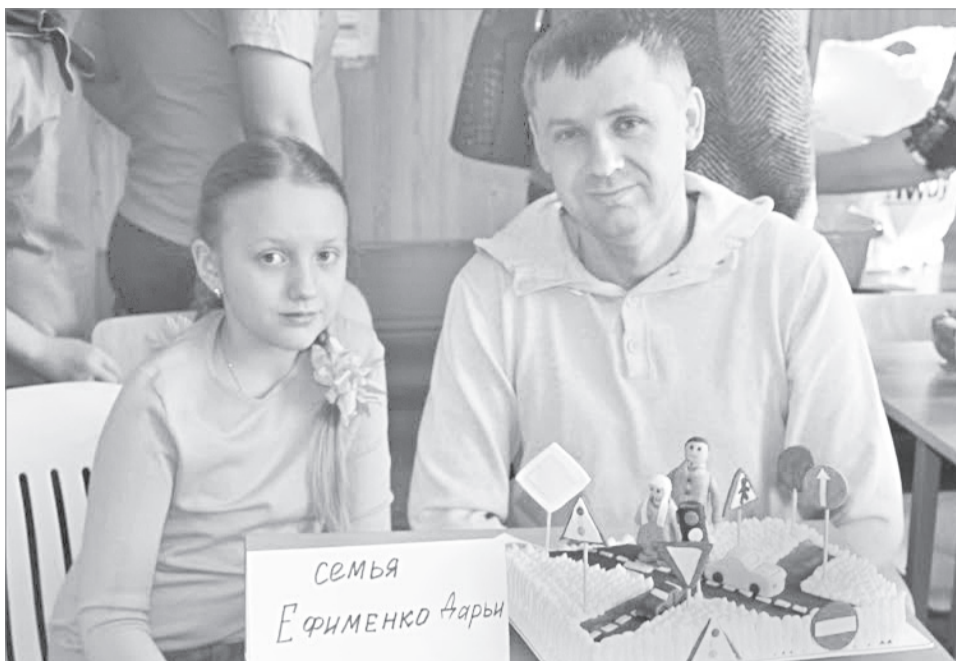
Торт семьи Ефименко оказался одним из самых вкусных и информативных