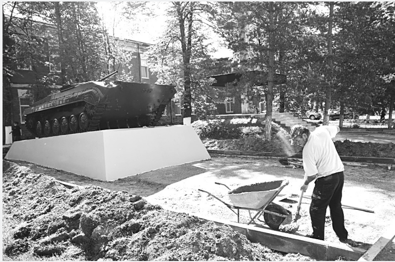
Осталось уложить брусчатку

встретили представителей заказчика – администрации города и подрядчика – ООО СК «Арагат». Оба дали мне свои комментарии.