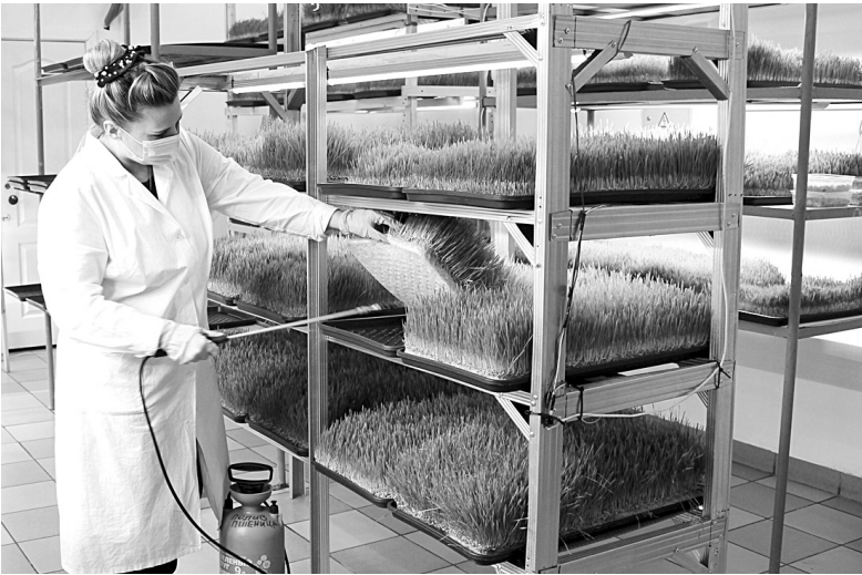
Полив ростков пшеницы городские аграрии производят снизу

кресс-салат, подсолнечник, свё- клу, капусту, дайкон и т.д. Дело в том, что совсем молодая ботва (от 2-3см до 10-15 в зависимости от вида) концентрирует в себе массу питательных веществ (ми- нералов, органических кислот, витаминов, биологически актив- ных соединений), необходимых растению в этот период для ак- тивного роста и деления клеток, растение как бы «заботится» о своём будущем. И человек мо- жет воспользоваться этим кон- центратом в своих интересах: ведь все эти вещества идут на пользу и нашему организму. Так, по сравнению со своими взрос- лыми «родственниками» микро- зелень по содержанию многих важных веществ опережает их в десятки раз.