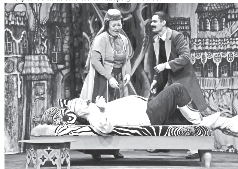
Сцена из спектакля «Ханума»

В детском репертуаре: 7 (воскресенье) и 22 (понедельник) февраля – «Гусёнок Дорофей». 14 (воскресенье) и 28 (воскресенье) февраля – «Крибле, Крабле, Бум!». 21 февраля (воскресенье) – «Цветочный перекрёсток». Касса работает с 10.00 до 14.00 и с 16.00 до 18.00. Выходной – понедельник. Начало спектаклей: детские – 12.00, вечерние – 18.00. Справки и заказ билетов по телефону 27-56-30.