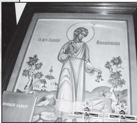
Икона святого Василия Мангазейского

У меня здесь своя творческая задача. Летом начала журналистское