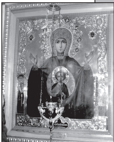
Икона Божией Матери Абалакской

Я опушу описание пути, которое к теме повествования не имеет отношения. Хотя процитировать отдельные поучительные истории отнюдь не помешало бы. Сплошь и рядом народ воцерковлённый. Слушать и слушать, теряя ощущение времени. Ну, что, поговорим, например, об одежде паломников. На службу я хожу в «маленьком чёрном платье». Ну, классика. Тёмное, строгое. Строже не бывает. Когда за несколько дней до поездки забежала в храм, женщины не советовали чёрное платье: не стоит. В монастырь в платье, «интригующем колени» – ни боже мой. Я вообще, скажу прямо, люблю демократичную, вечно молодую джинсу. Но демократия – не для святых мест. Это надо понимать. Мне прямо в храме подобрали юбку-фартук в пол. Тёмную, в мелкий цветочек. Примерила. Получила свою долю одобрения наших прихожан. Платок. Удобная, лёгкая обувь без каблука с собой. Сапоги на сплошной