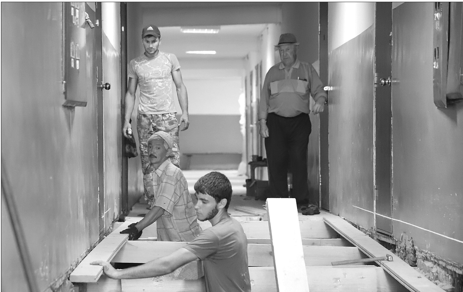
Специалисты ООО «Голышмановотеплосервис» укладывают полы в Доме ветеранов. Жильцы внимательно наблюдают за работой строителей

ЕСТЬ НОВОСТЬ? ПИШИТЕ, ЗВОНИТЕ: ☎ 8-(34546)-2-50-34; 2-56-69 @ GOL_VESTNIK@MAIL.RU