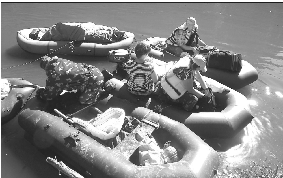
Сплавсредство состоит из нескольких скреплённых между собой лодок

Наталья ГЛАДКОВСКАЯ. Фото из архива проекта «Вагай – малая река Сибири».