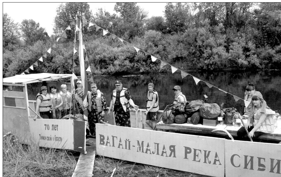
Таким судно туристов было пять лет назад