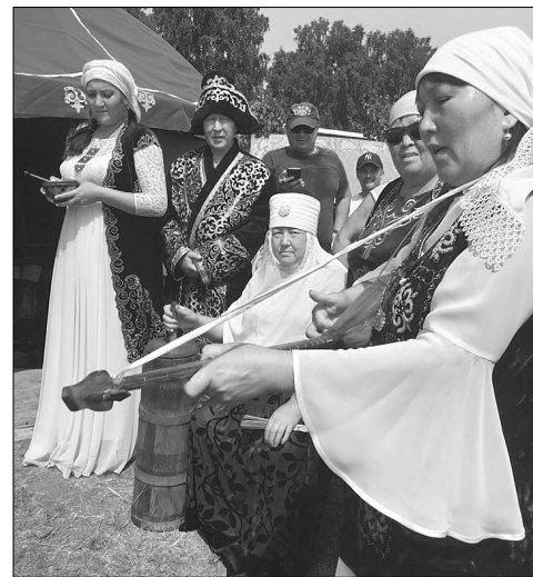
В областном казахском празднике Курултай в селе Исетском приняла участие делегация Голышмановского городского округа