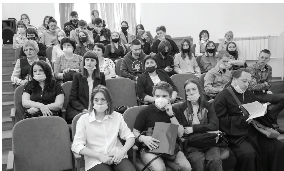
В 15-й раз научно-практическая конференция – Кирилло-Мефодиевские чтения – подтвердила статус хорошо организованного духовного межрегионального форума.