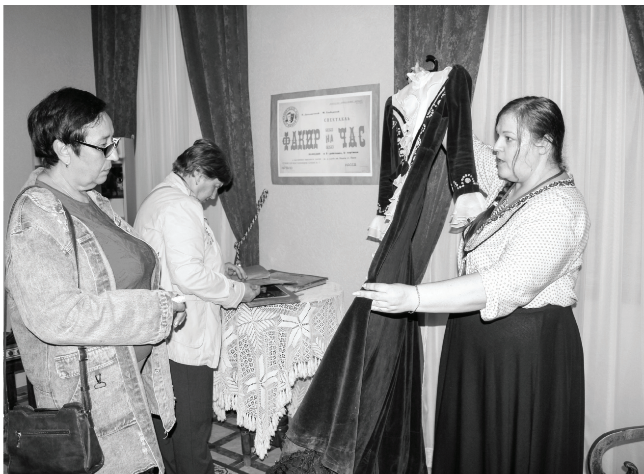
«Ночь музеев» – ещё одна возможность прикоснуться к прекрасному, вспомнить историю, научиться новому.

В рамках Всероссийской акции «Ночь музеев» 21 мая в музее «Городская управа» были открыты новые выставки, шли показы.