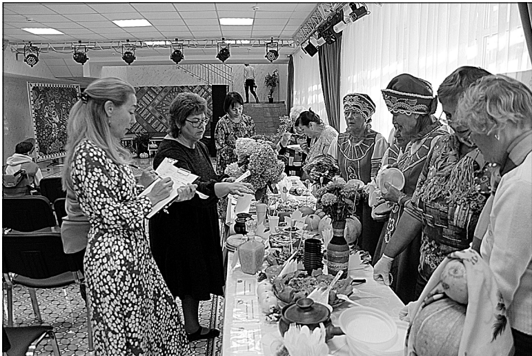
Жюри высоко оценило блюда из тыквы.

Участники встречи представили на суд жюри сшитые своими руками детские наряды из натуральных материалов, вечерние платья и домашнюю одежду из хлопка, созданные с любовью и