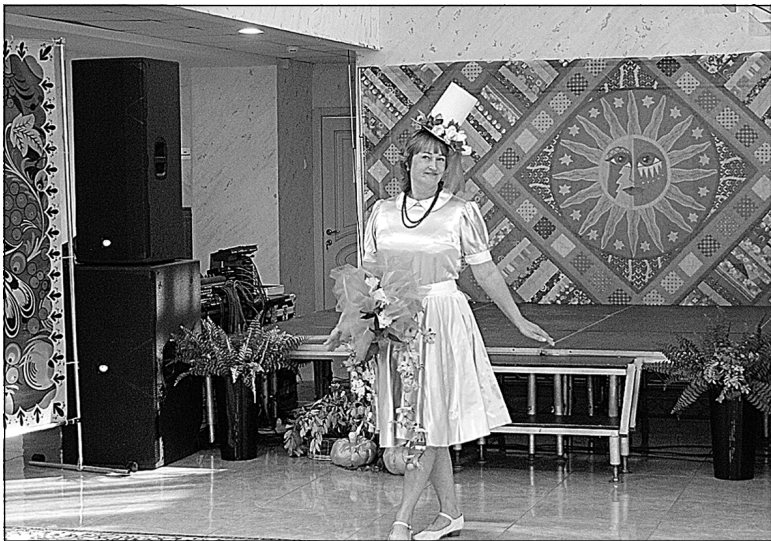
Дефиле «Ситцевая осень».