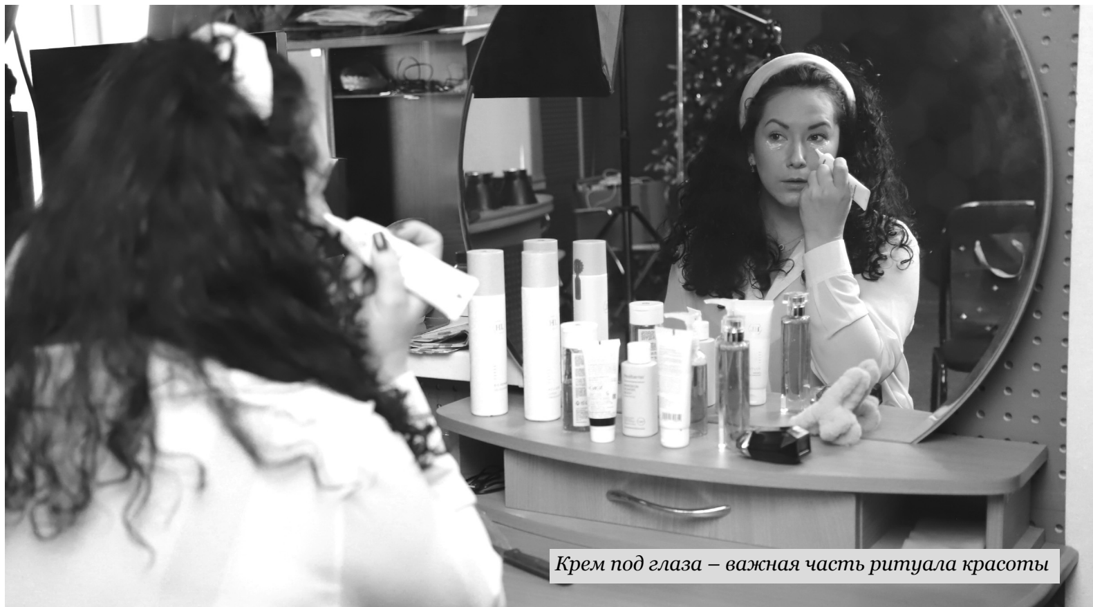
Крем под глаза – важная часть ритуала красоты