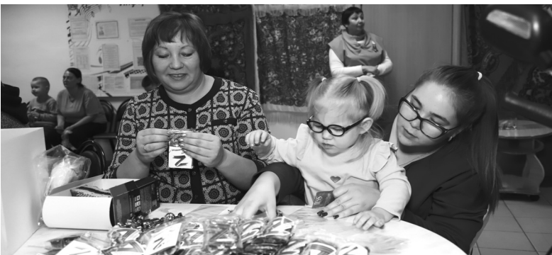
В мастер-классе по изготовлению чайных сувениров смогли поучаствовать даже малыши

Черемшанское отделение благотворительного штаба «СВОих не бросаем» уже третий год оказывает различную поддержку участникам специальной военной операции.