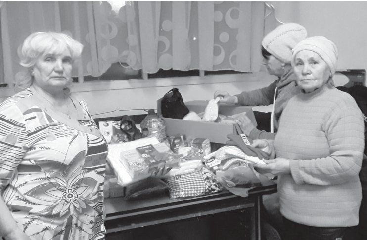
Участники акции по сбору гуманитарной помощи из Усть-Тавды

Члены Ярковского районного совета ветеранов принимают активное участие в акции по сбору добровольной гуманитарной помощи беженцам из Донецкой и Луганской народных республик. Предоставленные нами вещи отвечают всем требованиям акции: сюда входят предметы первой необходимости, средства гигиены, постельные принадлежности, продукты питания с длительным сроком хранения. Также здесь собраны товары для детей – игрушки, книжки-раскраски, тетради, одежда и обувь.