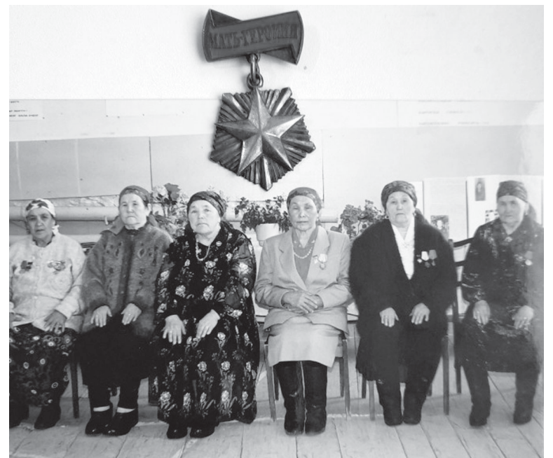
Многодетные матери из села Чечкино

...Наши скромные матери, сами бывшие детьми страшной войны, смогли поднять на ноги и вывести в люди своих детей, дав каждому из них достойное образование. Среди чечкинцев есть трудолю-