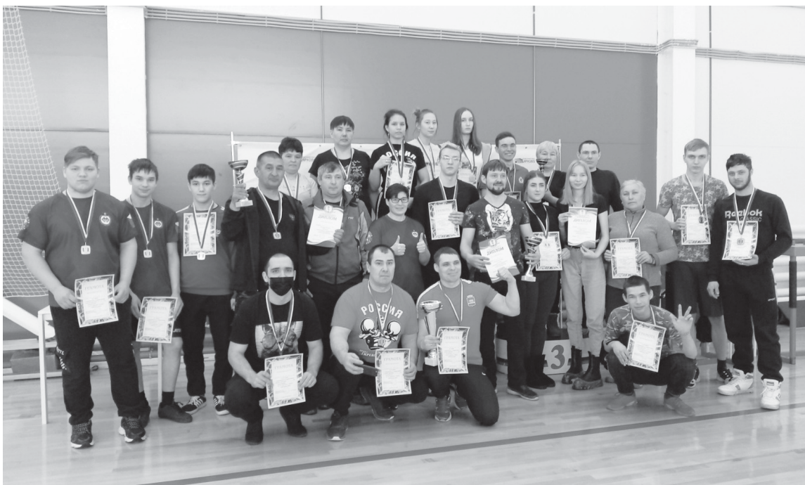
Призеры соревнований по армрестлингу

Спортивная жизнь Ярковского района не стоит на месте. Так, 26 февраля в спортивном комплексе прошли соревнования по армрестлингу в рамках 28-х районных зимних спортивных игр. Интерес к рукоборству проявили не только крепкие парни из сельских поселений, но и представительницы прекрасного пола. В каждой категории наблюдалась упорная борьба, и вплоть до финальных схваток нельзя было однозначно назвать победителей.