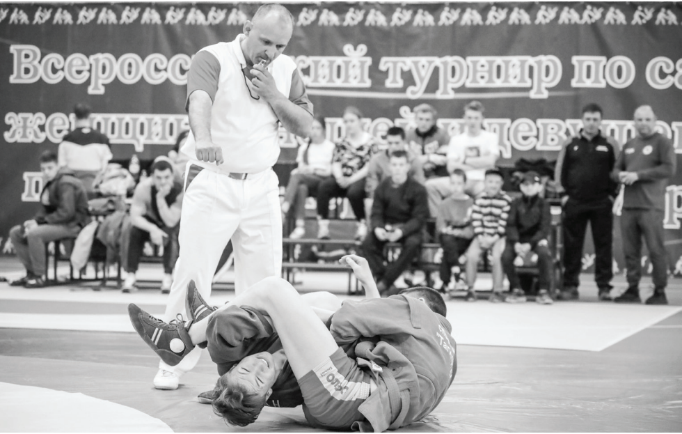
С 2013 года через участие в этом турнире 53 человека выполнили норматив мастера спорта России, более 80 – норматив кандидата в мастера спорта по самбо.

Красивой борьбы на хорошо организованном тур-