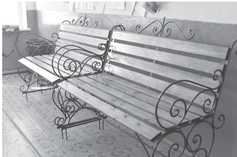
К 9 мая 2022 года эти скамейки займут свое место рядом с памятником участникам Великой Отечественной войны в Усалке

перехода и остановки на федеральной трассе. Надеюсь, что нынешним летом данные работы будут выполнены, и усальчане, как и раньше, смогут беспрепятственно ездить, когда им удоб-