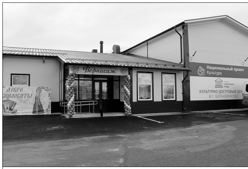
Новый клуб в селе Богандинское вырос на месте старого.

В Богандинском деревянный клуб, построенный в 70-х годах прошлого века, был, но в 2012 году он сгорел. Сегодня на его месте в самом центре села выросло современное, комфортное и безопасное здание из модульных конструкций. Площадь клуба 300 квадратных метров, но помещения многофункциональные: зрительный зал легко трансформируется для проведения самых разных мероприятий, а уютная библиотека поделена на взрослую и детс-