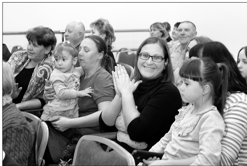
Открытию клуба рады и дети, и взрослые.