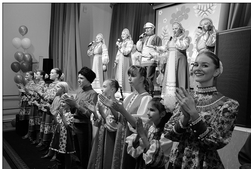
Поздравить жителей Нижнепышминского МО с открытием клуба приехали артисты из других территорий «столичного».