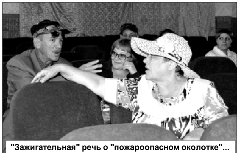
"Зажигательная" речь о "пожароопасном околотке"...