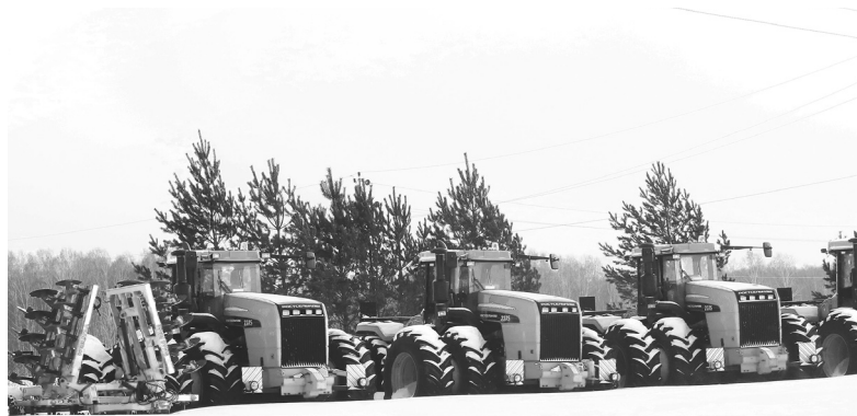
Техника агрохолдинга «Голышмановский» готова к выходу в поле