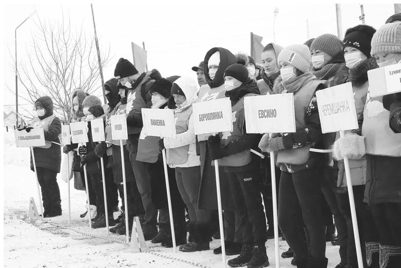
На традиционном параде открытия минимальное число спортсменов – от каждой команды не более пяти человек