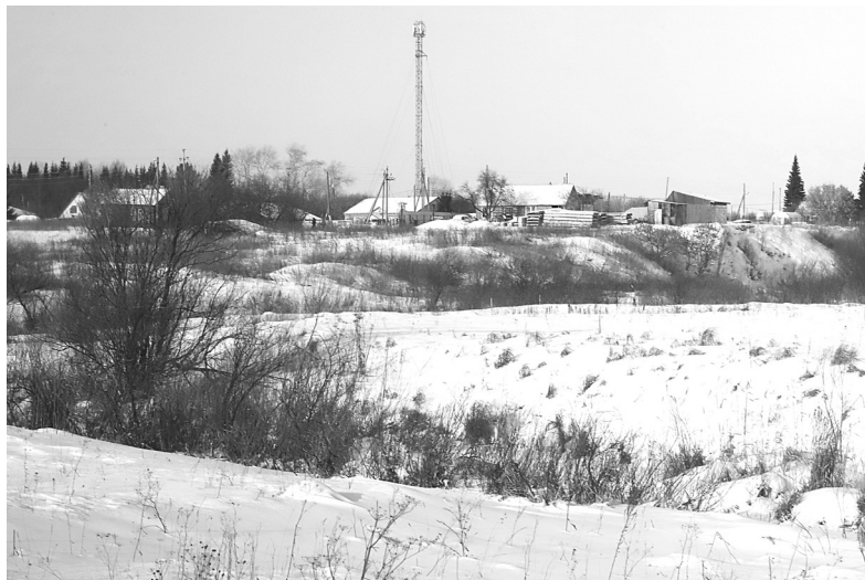
У Евсинской территории есть перспективы развития