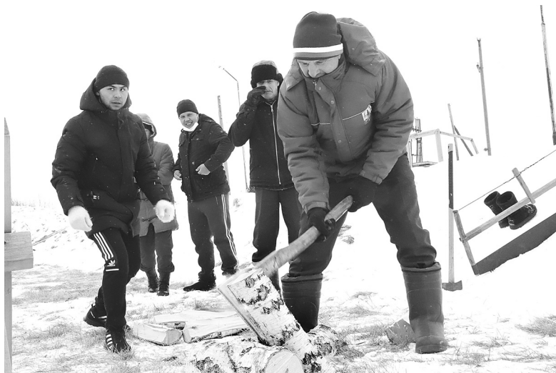
Крестьянскую закуску участники спортивных игр демонстрировали в профессиональном многоборье