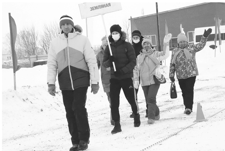
На церемонии открытия соревнований колонну возглавляли земляновские спортсмены – победители 40-х зимних спортивных игр

Среди команд посёлка победителем стала сборная администрации городского округа, на втором месте – спортсмены агро-