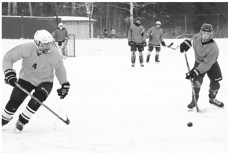
Итоговый хоккейный матч состоялся между командами села Медведево и агропедколледжа

В селе Медведево 13 февраля состоялся финал 41-х зимних спортивных игр Голышмановского городского округа. Часть соревнований прошли ранее по зональному принципу в два этапа.