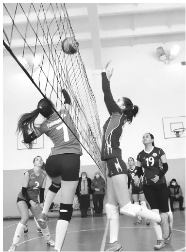
В финале игр встретились четыре женские волейбольные команды