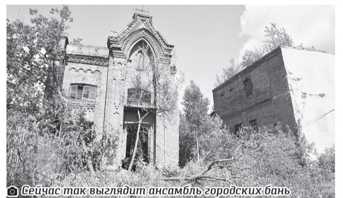
Сейчас так выглядит ансамбль городских бань