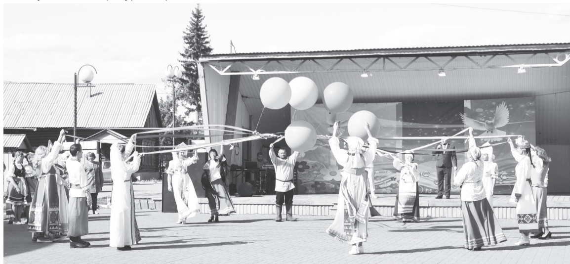
Ежегодно в Упоровском районе проводят «Мост дружбы».