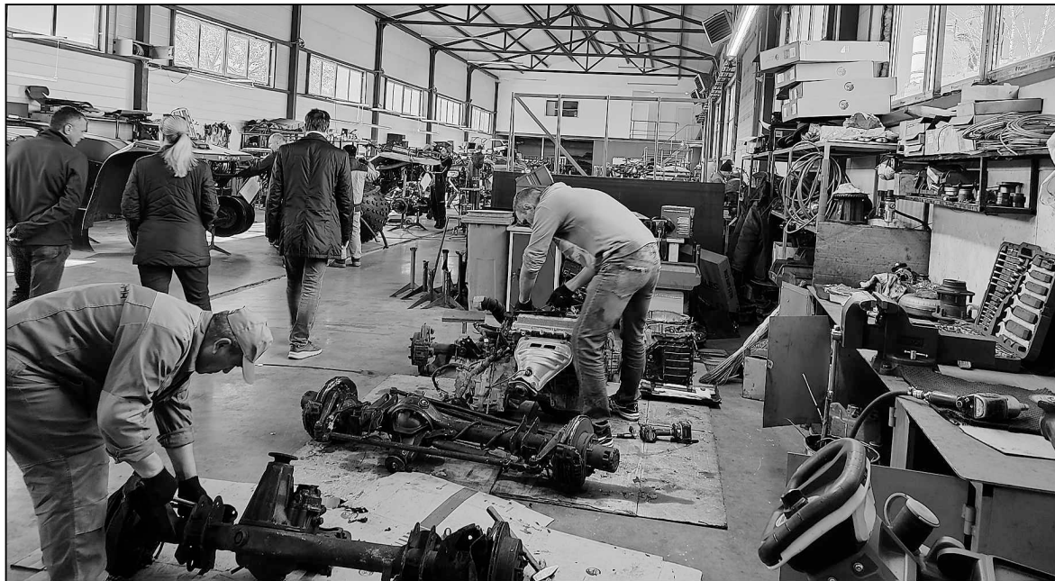
На заводе создают новые образцы, восстанавливают машины с пробегом.