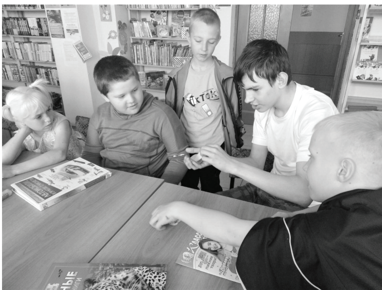
Участники турнира показали себя настоящими знатоками литературы.

В первом раунде участникам было предложено по начальной строчке угадать стихи и продолжить рассказывать их всей командой. А когда шла речь о детективном жанре, игрокам нужно было отгадать литературного героя, о котором говорилось в песне. В «Блицэрудитии» команды отвечали на вопросы. Турнир был очень интересным, зарядил