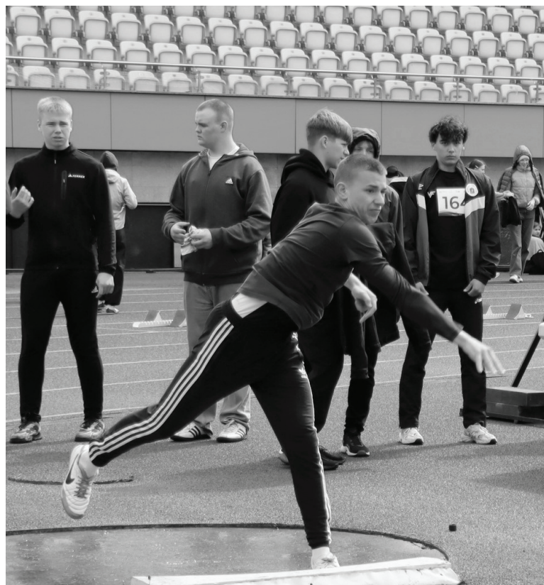
На протяжении двух дней спортсмены соревновались в беговых и технических дисциплинах.