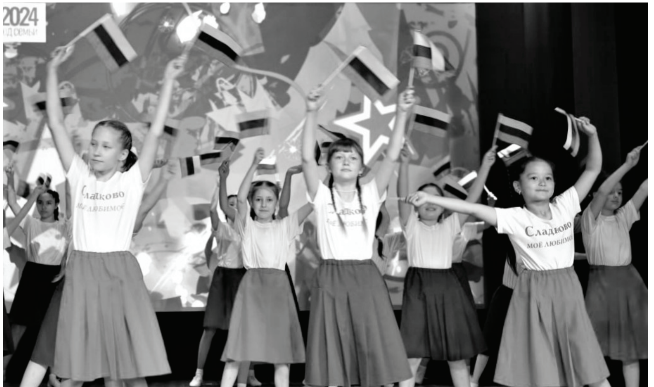
В торжественной обстановке сладковцы чествовали нашу Родину – страну с великой историей.

В рамках Всероссийской акции «Российский триколор» активисты «Движения Первых» раздавали всем гостям нагрудные ленты с триколором.