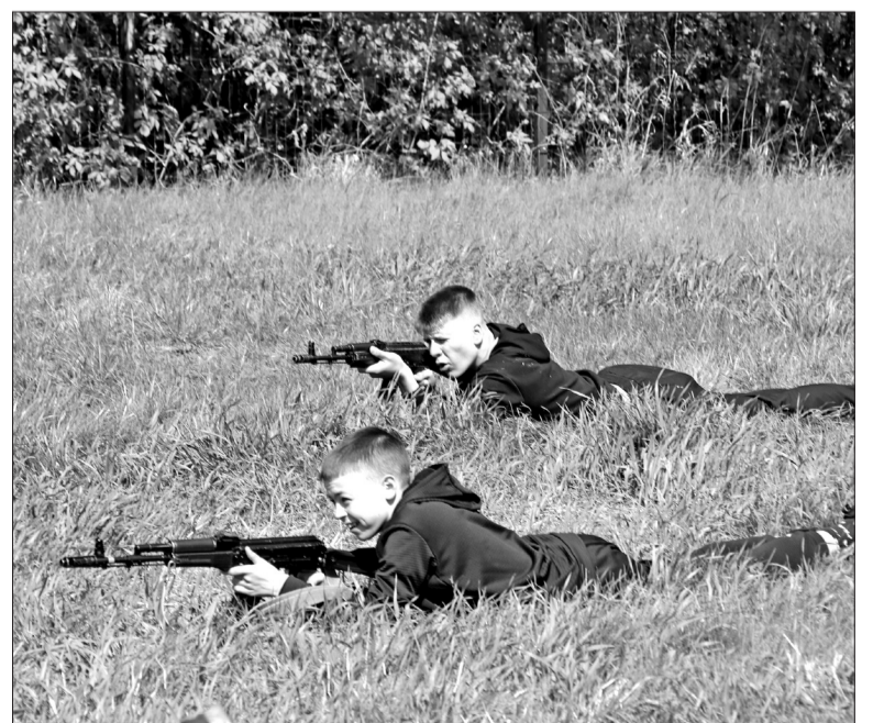
📍 Ученики восьмого класса выполняют тактическое упражнение с автоматом.

Учебные сборы шли три дня. Глядя на ребят, бегущих с макетами автоматов, на их дисциплинированность и стойкость, становится понятно, что подобные мероприятия необходимы для повышения уровня обороноспособности страны и формирования у молодого поколения патриотических чувств.