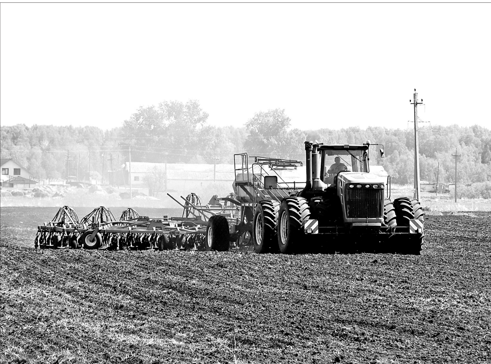
📷 Сегодня основная часть сил ООО «Возрождение» брошена на посев пшеницы.

Сельское хозяйство. Аграрии муниципального округа отдадут все силы весенним полевым работам