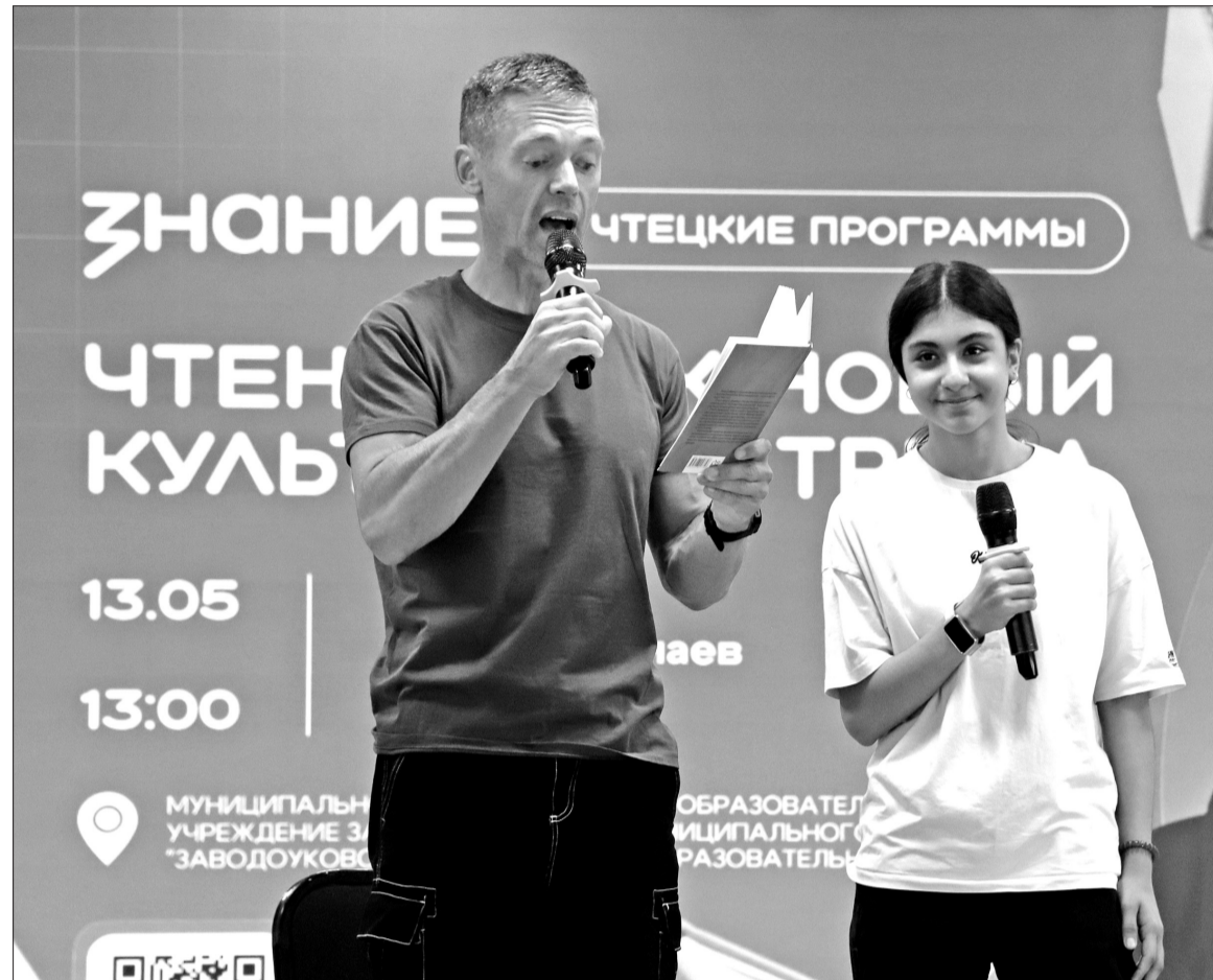
📍 Российский актёр, лектор общества «Знание» Михаил Мамаев даёт мастер-класс по чтению стихов на примере произведения из своего сборника.

У нас в городе. Известный российский актёр и телеведущий посетил Заводоуковскую школу № 2