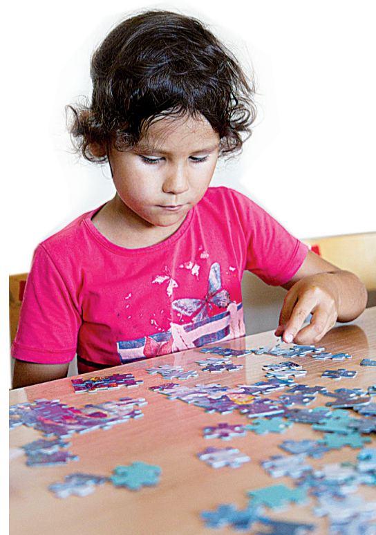
Пазлы – это всегда увлекательно

Нет, эта страна не из красногалстучного детства, о котором до сих пор вспоминают многие люди старших поколений. Она родилась благодаря красивой легенде, которую придумали взрослые – педагоги и воспитатели. Одними из основных законов этой страны являются добро и вера.