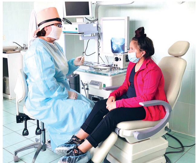
Универсальный рабочий инструмент совмещает в себе несколько аппаратов для диагностики и лечения

Кроме того, для таких процедур, как промывание носа и ушей, предусмотрена автоматическая система орошения с подогревом