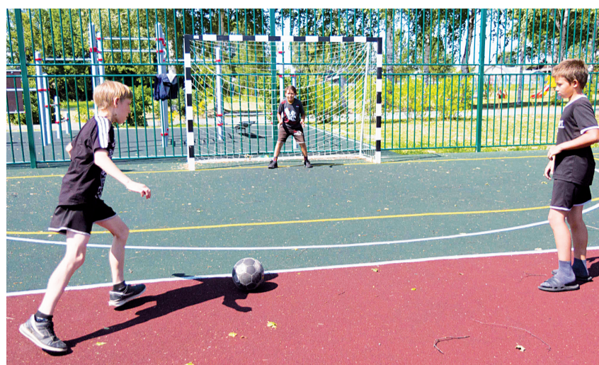
На футбольном поле кипят жаркие страсти

шахматист, который уже не раз защищал честь школы на шахматных соревнованиях, предпочитает посидеть в тишине, поразмышлять логически, продумать ход будущих комбинаций. погружаются в сладкий сон. – Малыши обычно просят почитать русские народные «Репку», «Колобок» и другие. Правда, не успевают дослушать, засыпают быстро, – говорит