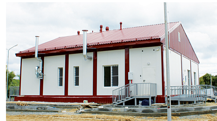
Школа в Епанчиной

Как сообщает пресс-служба Тобольского района, в районе не только ремонтируются школы, но и строятся новые. В д. Епанчиной готовится к сдаче новая начальная школа, которая откроет свои двери 1 сентября. Модульное здание возлези по региональной программе, которая предусматривает замену ветхих деревянных школ в Тюменской области. Кроме учебных кабинетов в школе спроектирован зал для занятий физкультурой, обеденный зал, помещение для группы кратковременного пребывания дошкольников. Сейчас ведётся