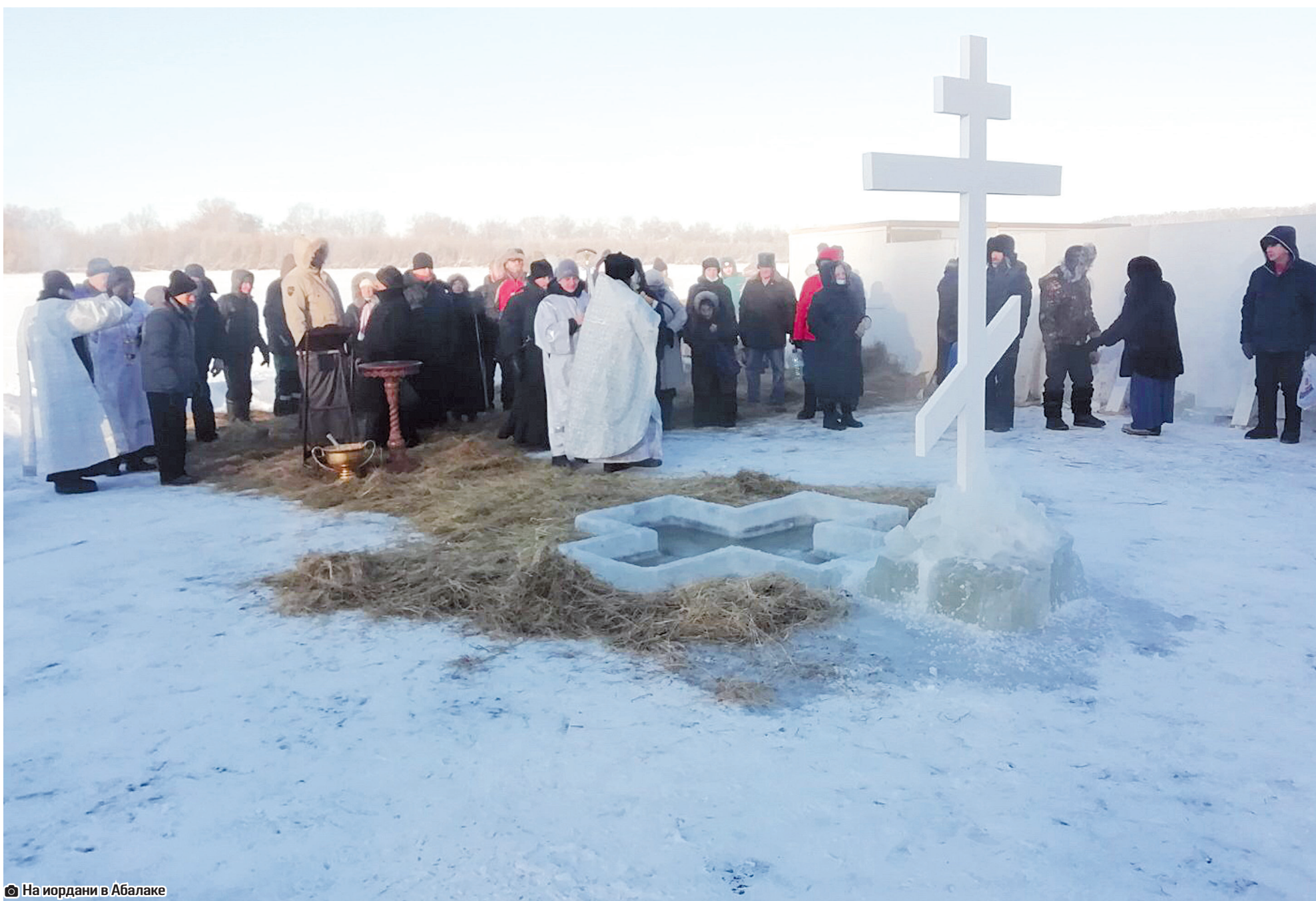
На иордани в Абалаке