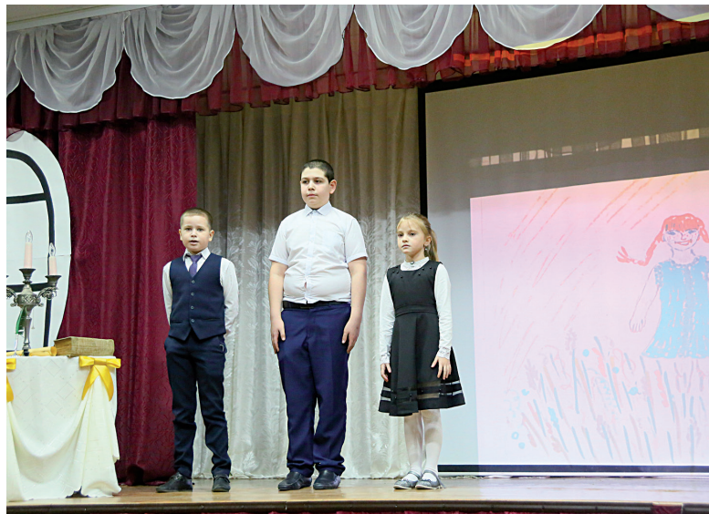
Юные чтецы из Булашово