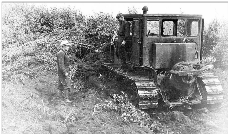
Идет разработка месторождений торфа.