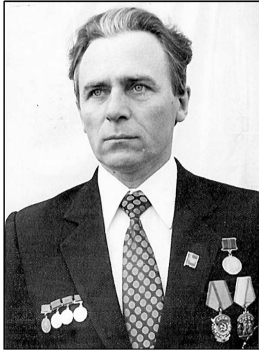
последнюю роль. За многолетний и добросовестный труд он был награжден орденами Трудового

Красного Знамени и «Знак Почета», юбилейной медалью «За добросовестный труд в ознаменование 100-летия со дня рождения В.И. Ленина», десятью медалями (золотой, серебряной, бронзовой) ВДНХ, многими Почетными грамотами и дипломами.