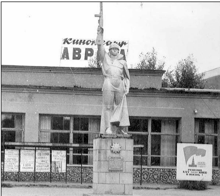
Кинотеатр «Аврора» и памятник героям-землякам.