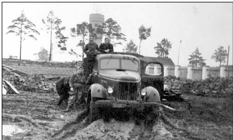
Улица Ленинградская в 50-е годы.