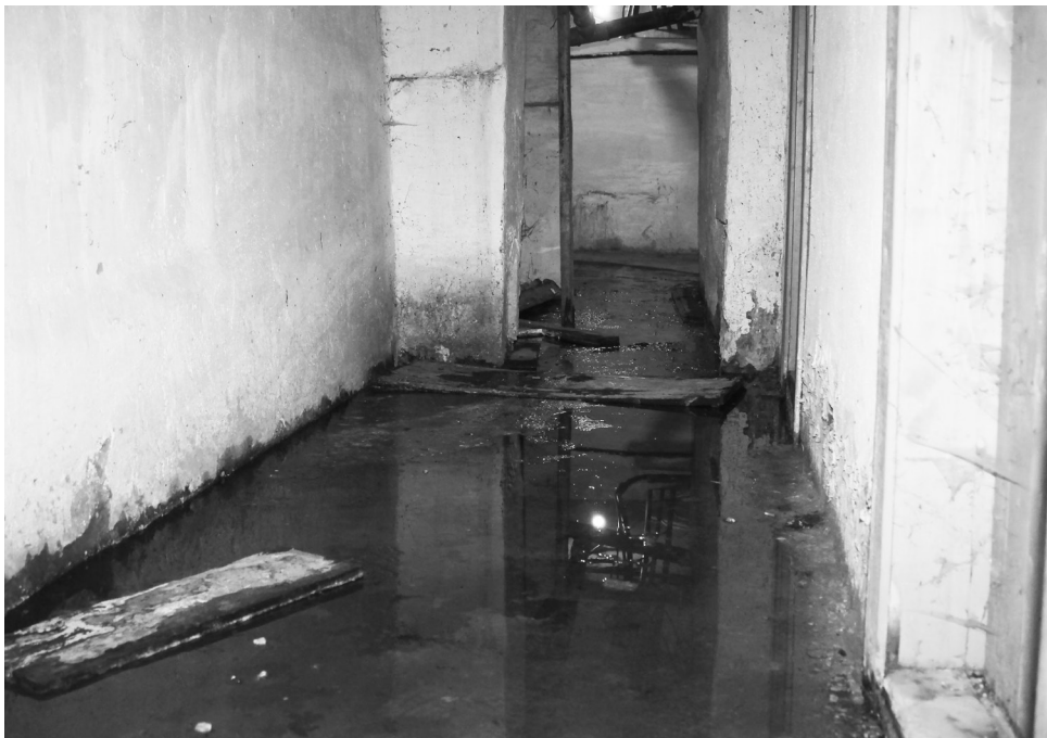
Так выглядит подвал дома по улице Калинина, 22. Невооружённым взглядом видно, что весь коридор залит водой, а жители уже успели набросать досок, чтобы была возможность пройти. Мы ещё вернёмся к этой теме, чтобы проверить, откликнулась ли управляющая компания на вопрос жильцов дома.