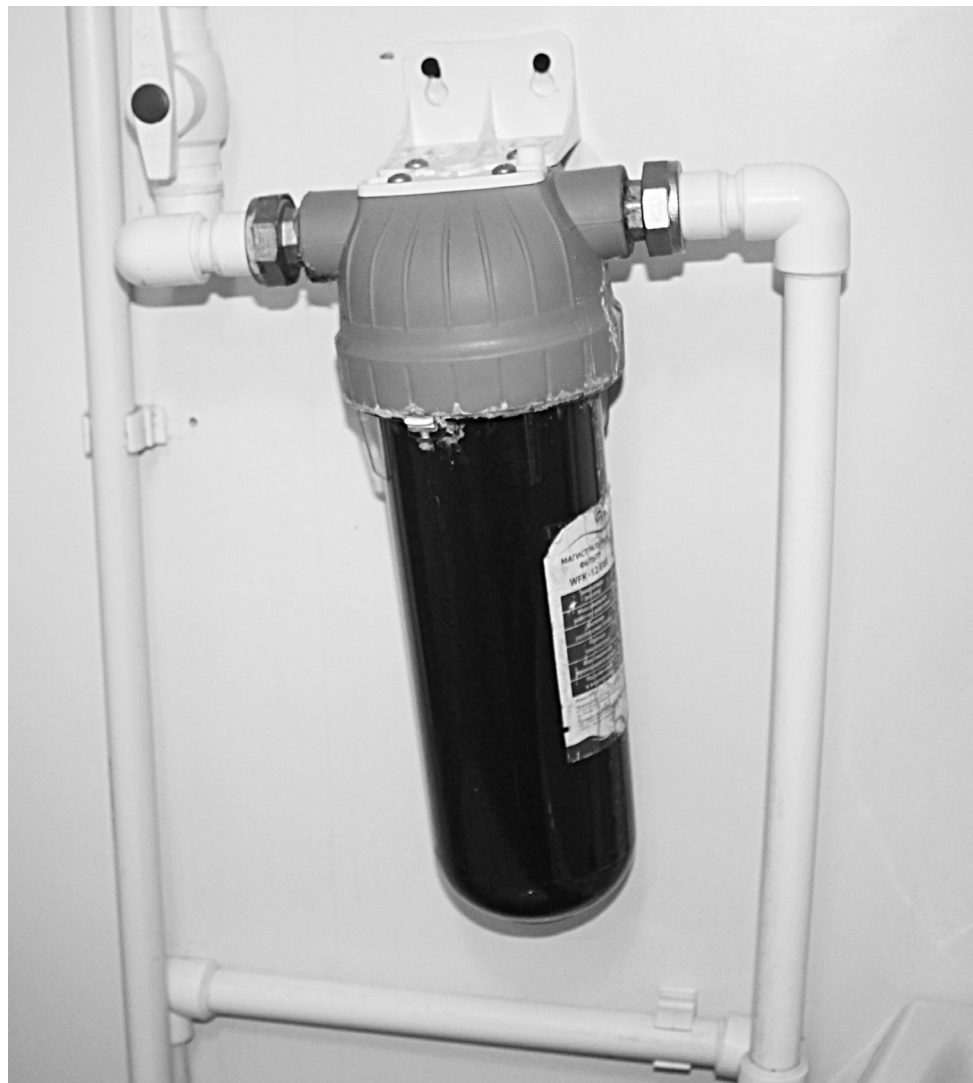
Водопроводные фильтры в квартирах по улице Сакко, 13 «Б» (корпус 1) после двухнедельного использования выглядят следующим образом: уже через несколько минут после замены ржавчина оседает на их поверхности.