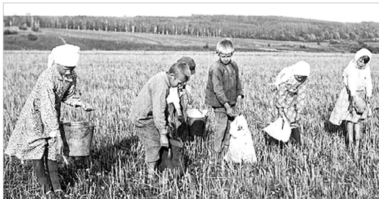
Другое детство — военное детство