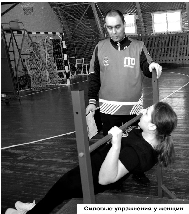
Силовые упражнения у женщин