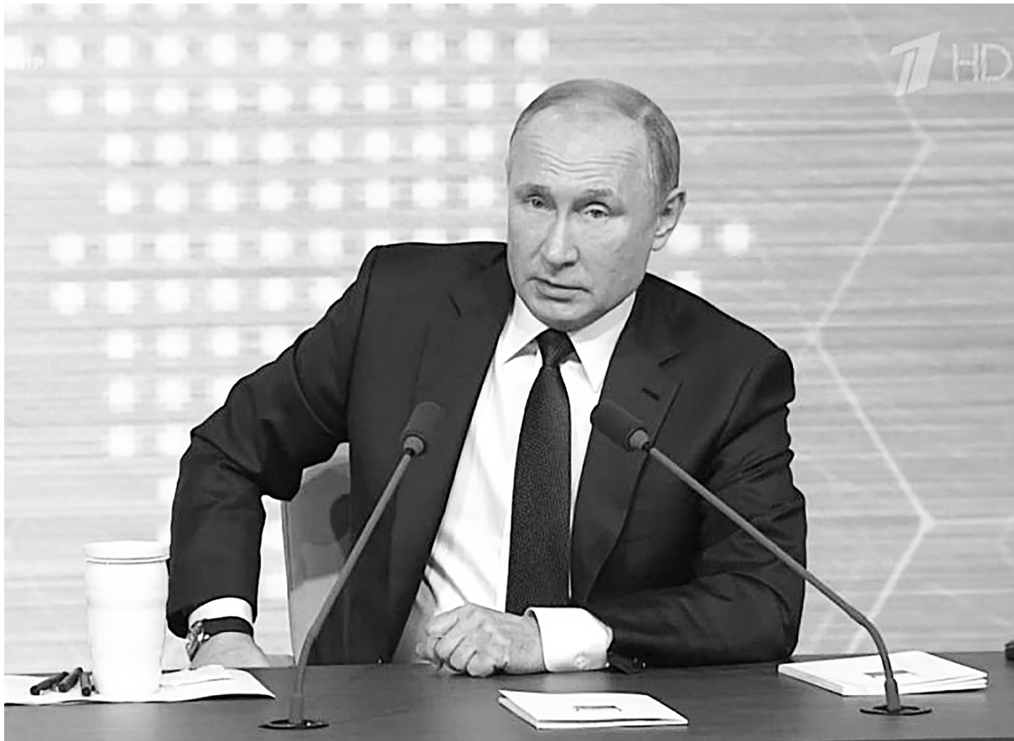
Скриншот трансляции Первого канала ежегодной большой пресс-конференции Президента России Владимира Путина.